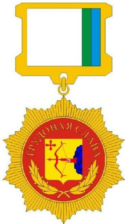
Почётный знак «Трудовая слава»