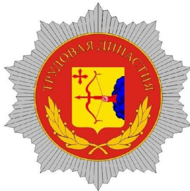
Почётный знак «Трудовая династия»