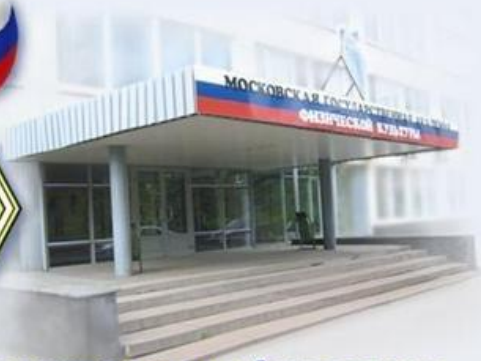
Московская Государственная Академия Физической Культуры