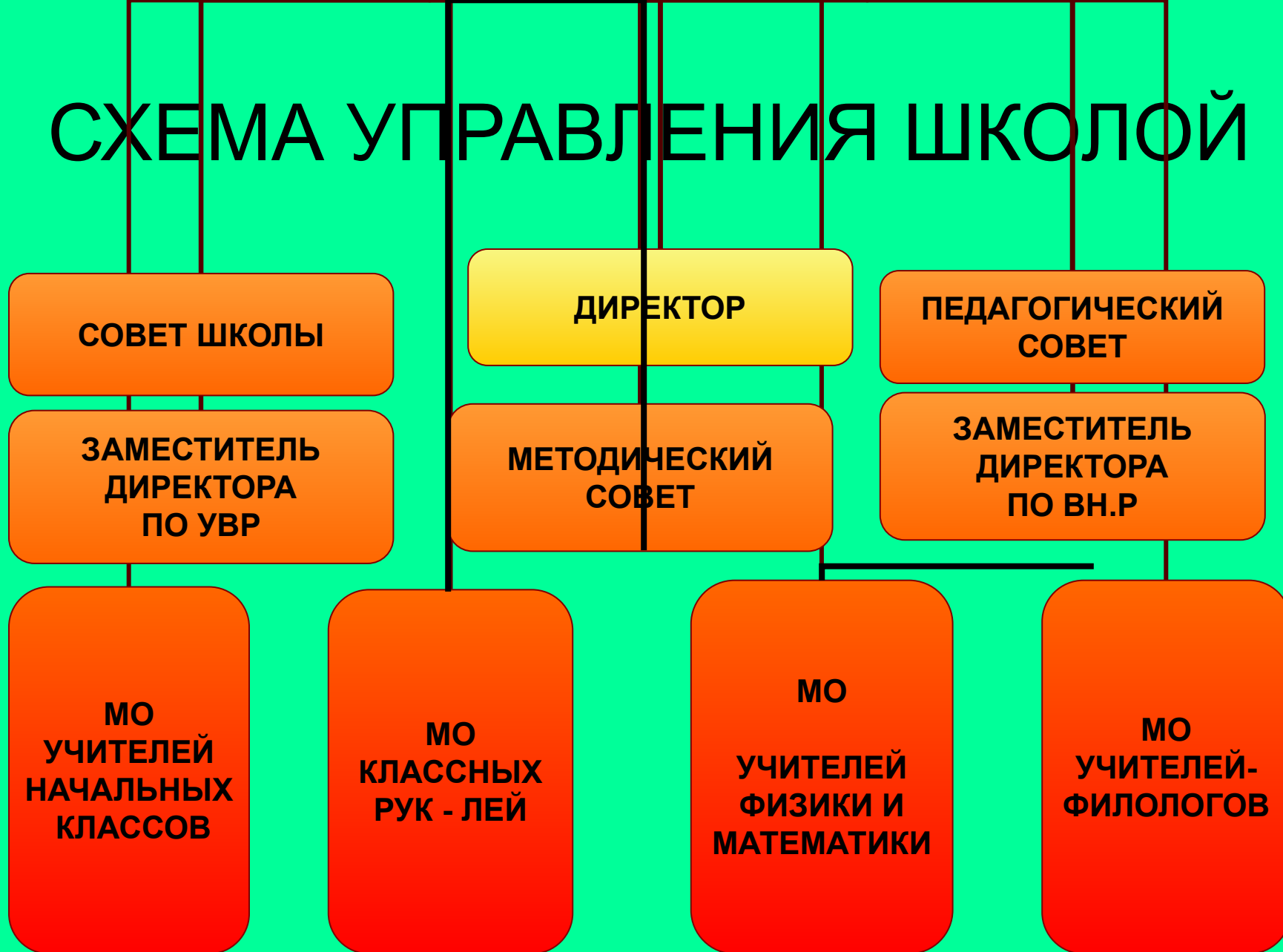
СХЕМА УПРАВЛЕНИЯ ШКОЛОЙ