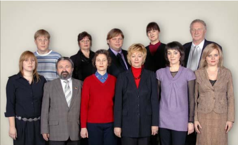
КОЛЛЕКТИВ КАФЕДРЫ ГОСУДАРСТВЕННОГО И МУНИЦИПАЛЬНОГО УПРАВЛЕНИЯ

В каждую группу очного отделения на первом курсе назначается куратор, который сопровождает ее на протяжении всего периода обучения, обеспечивая взаимодействие студентов с кафедрой.