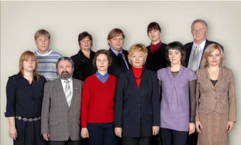
КОЛЛЕКТИВ КАФЕДРЫ ГОСУДАРСТВЕННОГО И МУНИЦИПАЛЬНОГО УПРАВЛЕНИЯ

В каждую группу очного отделения на первом курсе назначается куратор, который сопровождает ее на протяжении всего периода обучения, обеспечивая взаимодействие студентов с кафедрой.