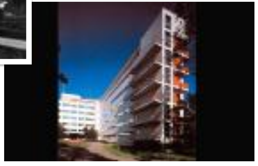
Санаторий в Паймио, 1933, арх. А. Аалто