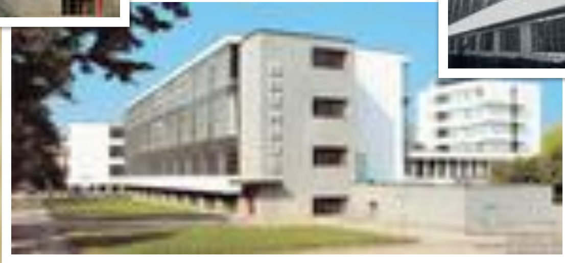
Здание Баухауза в Дессау, арх. В. Гропиус