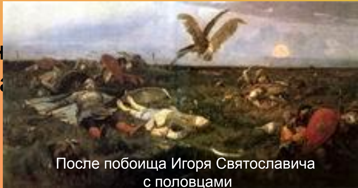
После побоища Игоря Святославича с половцами

Несколько картин объединяет одна тема, посвящённая «Слову о полку