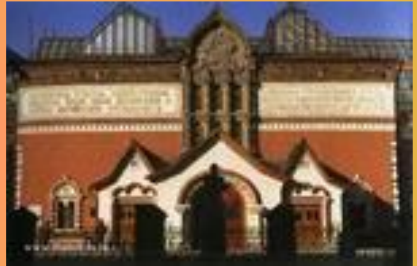
фасад Третьяковской галереи

По чертежам В.М. Васнецова исполнены некоторые архитектурные работы: церковь в Абрамцеве, фасады Третьяковской галереи, Музея Цветкова и другие работы