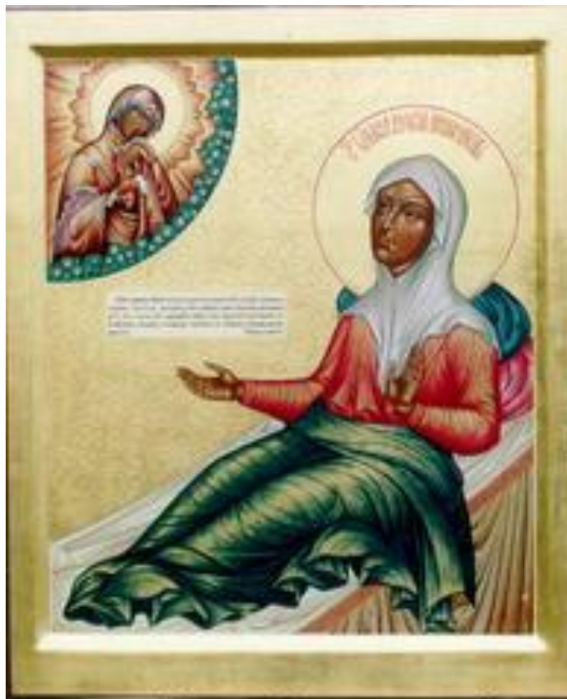
Блаженная Матрона Анемнясевская. Икона.