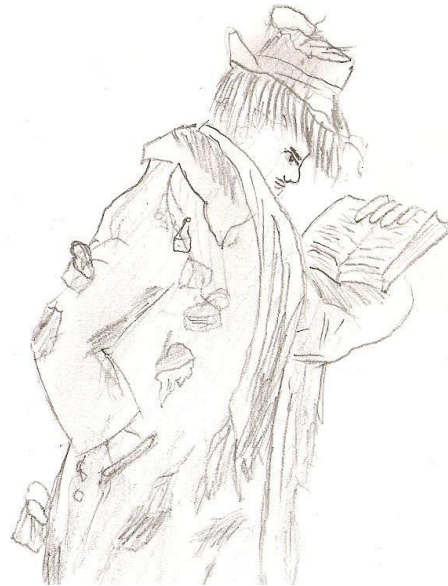
Деревенский юродивый. Чернокнижник