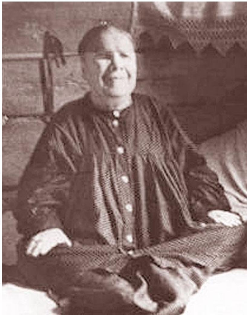
Блаженная Матрона при жизни http://belgorod.aif.ru/issues/694/01_01