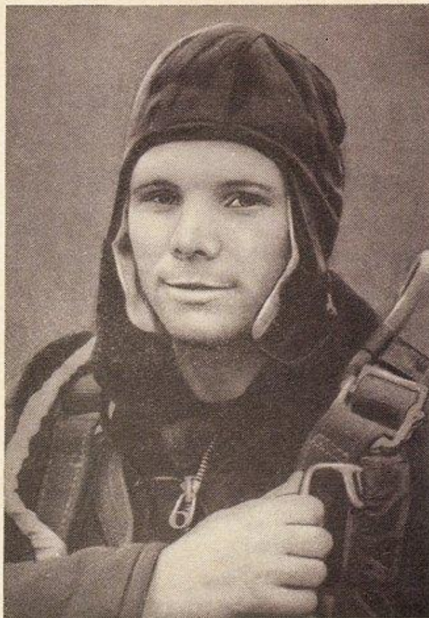
Пламенный привет первому советскому герою-космонавту Юрию Алексеевичу ГАГАРИНУ