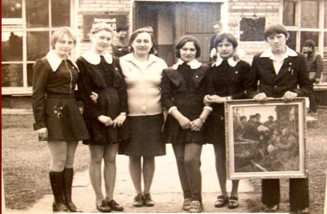
Делегация Кольванской с/ш, прибывшая на торжество