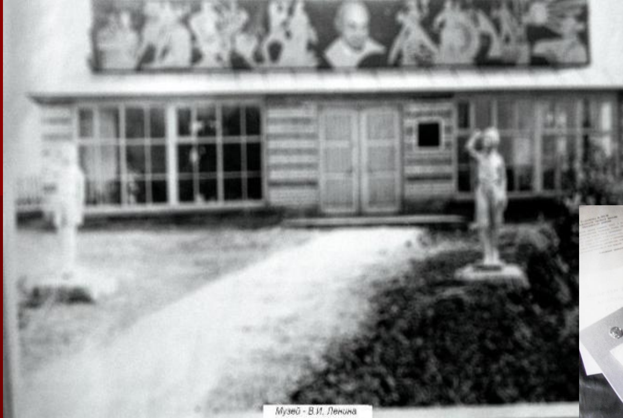
Музей - В.И. Ленина