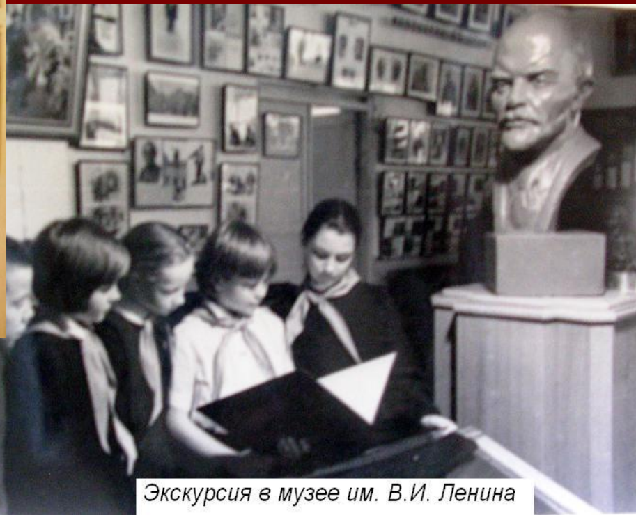
Экскурсия в музее им. В.И. Ленина