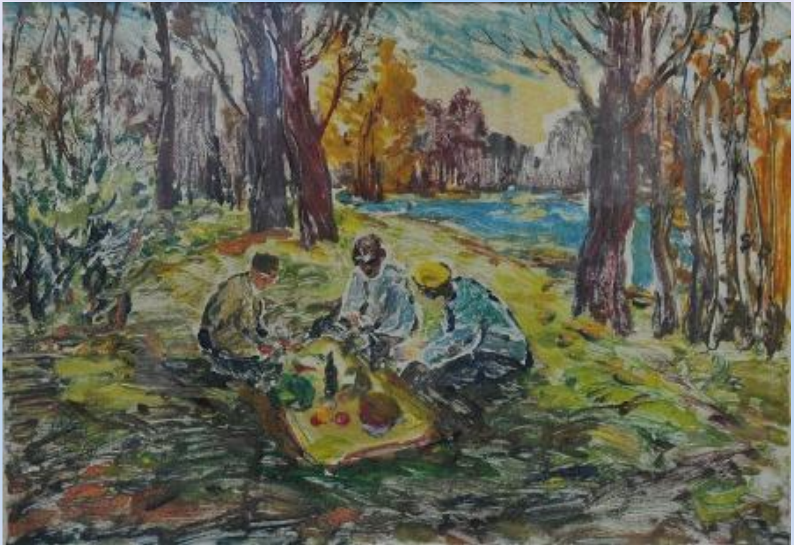
«На поляне у реки»