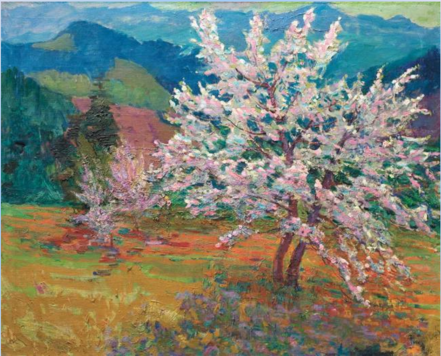
«Весна в Карпатах»