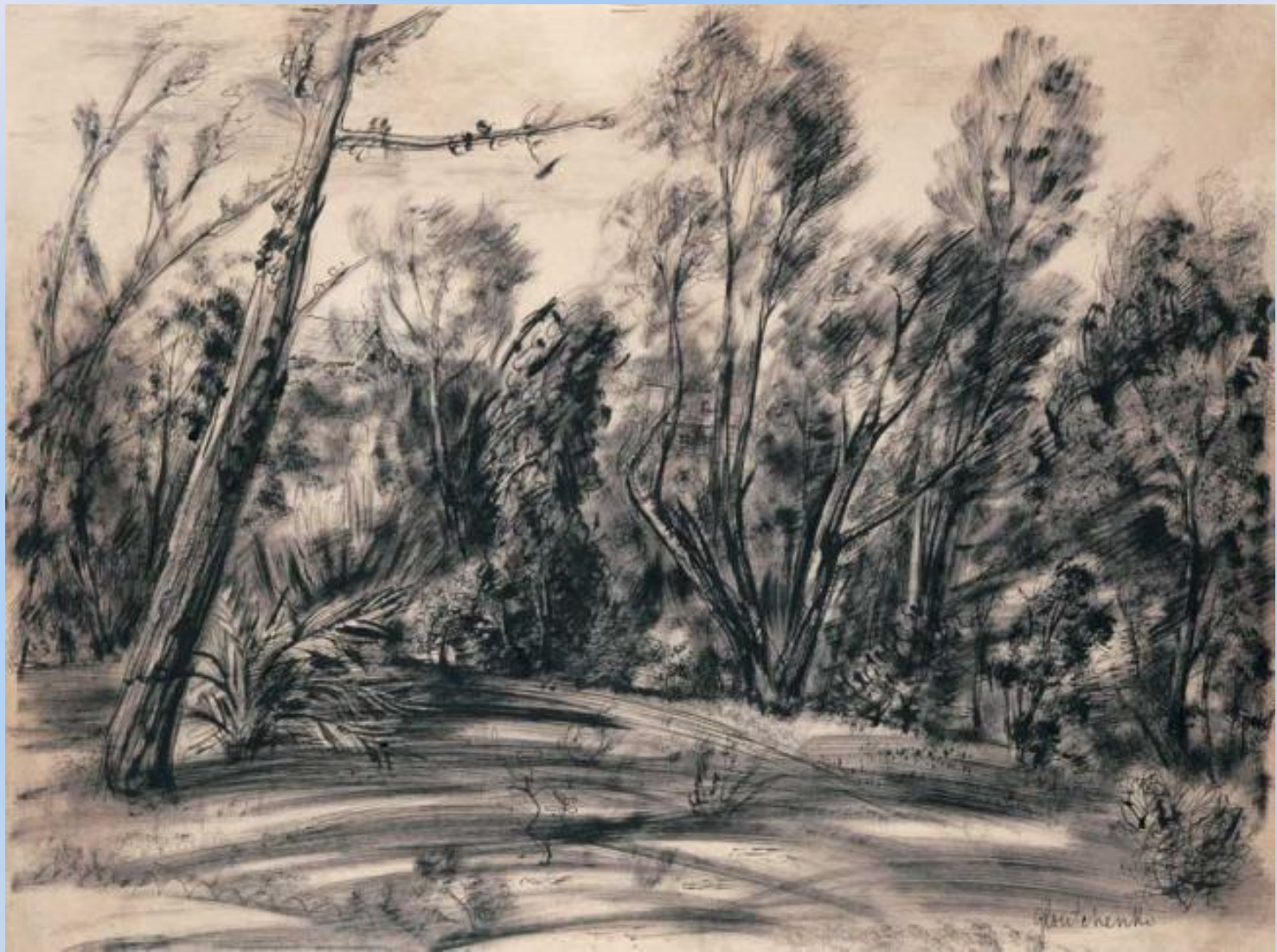
«Парк в Париже»