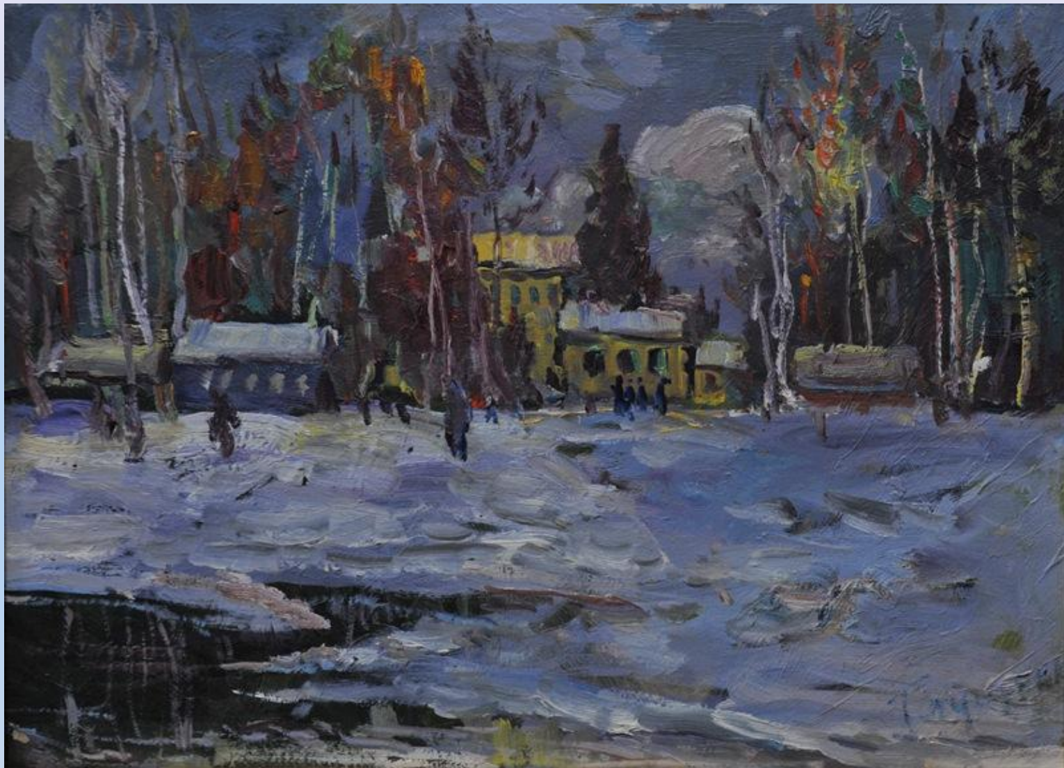
«Окрестности Киева в зимнее»