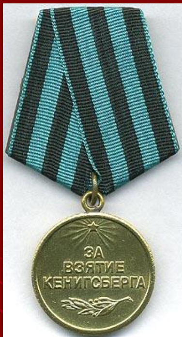
Медаль «За взятие Кёнигсберга»