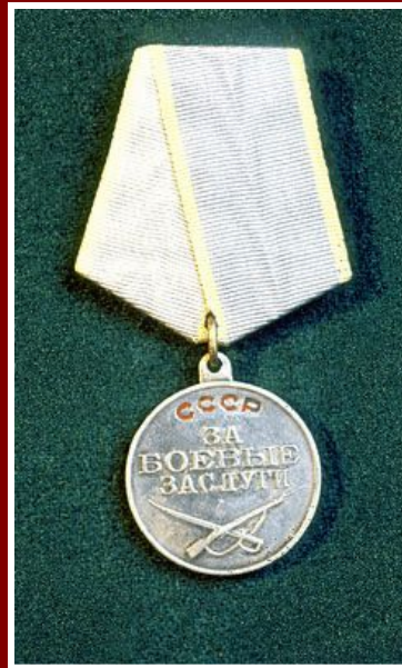
Медаль «За боевые заслуги»