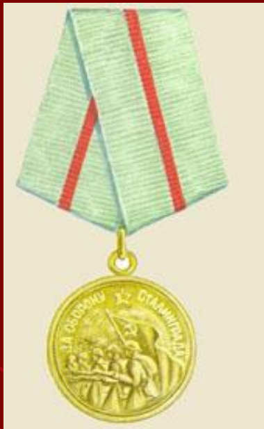
Медаль «За оборону Сталинграда»