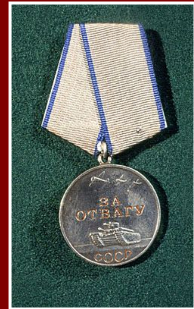
Медаль «За отвагу»