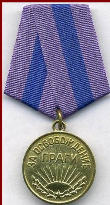
Медаль «За освобождение Праги»