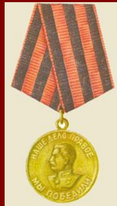
Медаль «За победу над Германией в ВОВ»