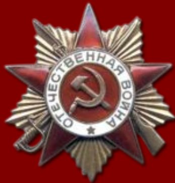
Орден Отечественной войны I степени