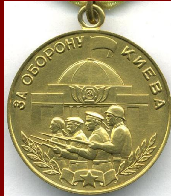
Медаль «За оборону Киева»