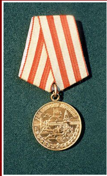
Медаль «За оборону Москвы»