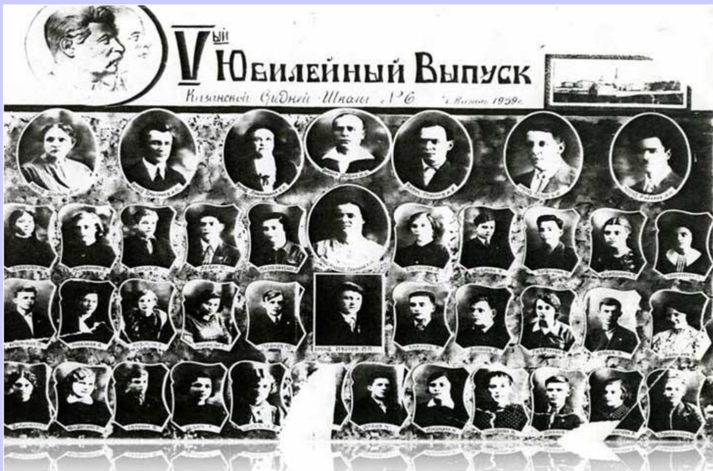
ВЫПУСКНИКИ ШКОЛЫ №6 ИМ. ДЕКАБРИСТОВ 1939Г.