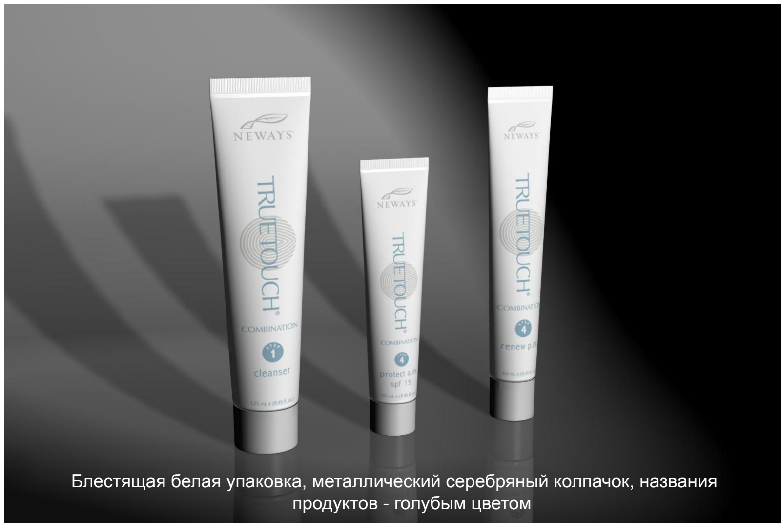
Блестящая белая упаковка, металлический серебряный колпачок, названия продуктов - голубым цветом