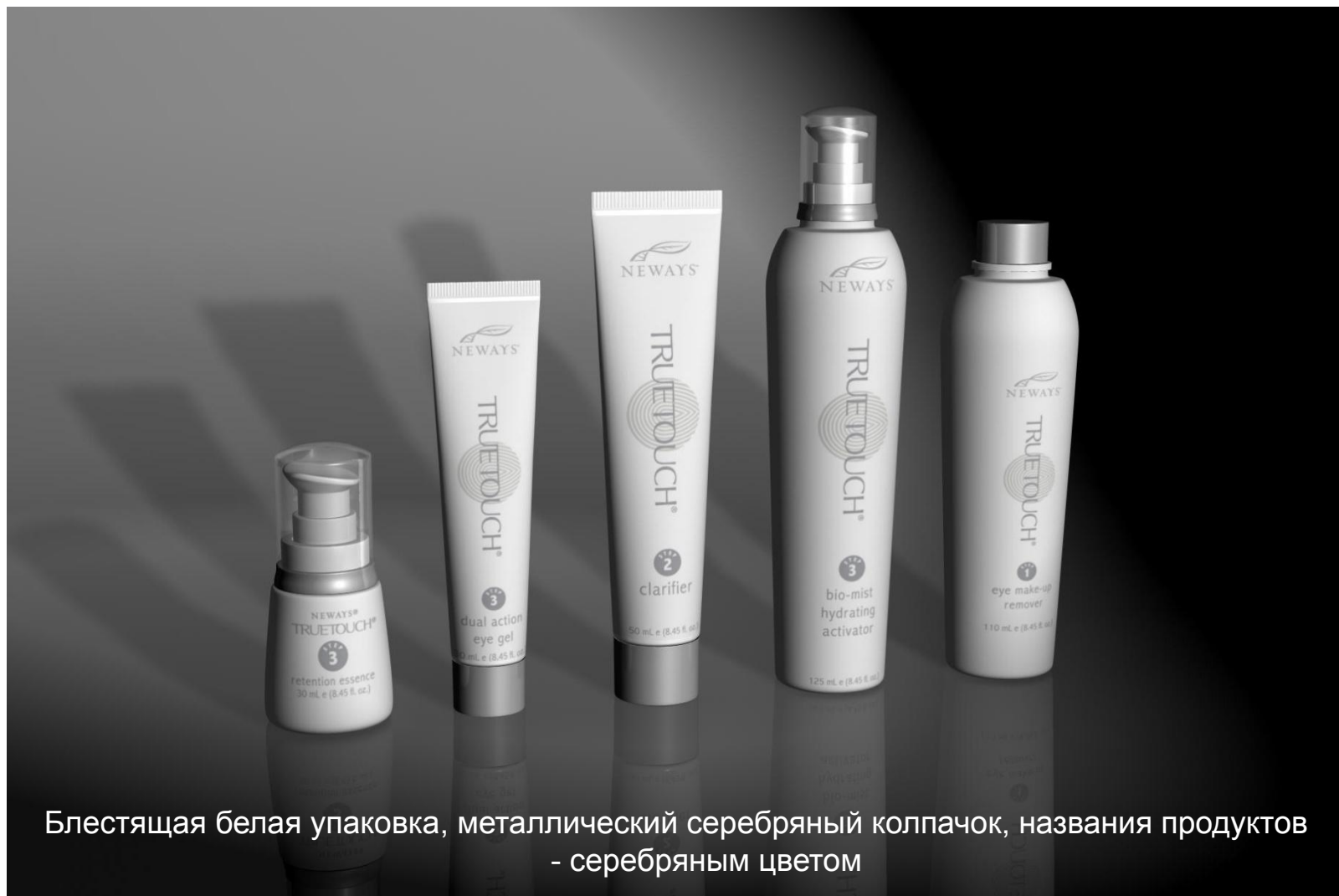
Блестящая белая упаковка, металлический серебряный колпачок, названия продуктов - серебряным цветом