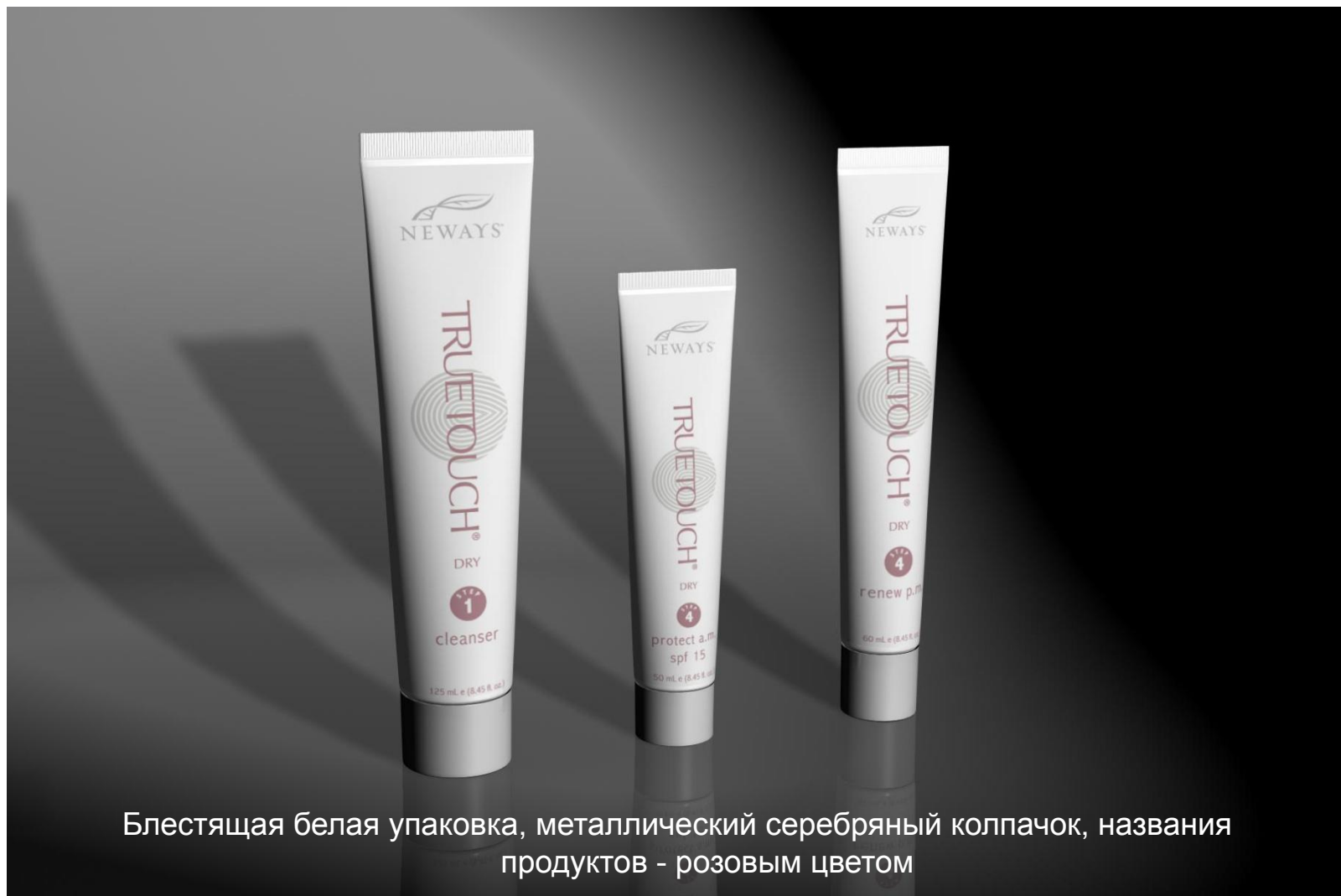
Блестящая белая упаковка, металлический серебряный колпачок, названия продуктов - розовым цветом