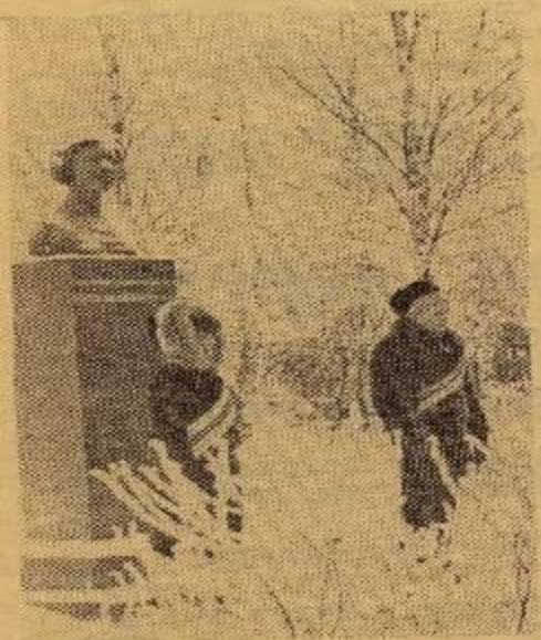
Почетный караул у памятника Герою Советского Союза Марии Мелентьевой в день Героя в п. Пряжа.