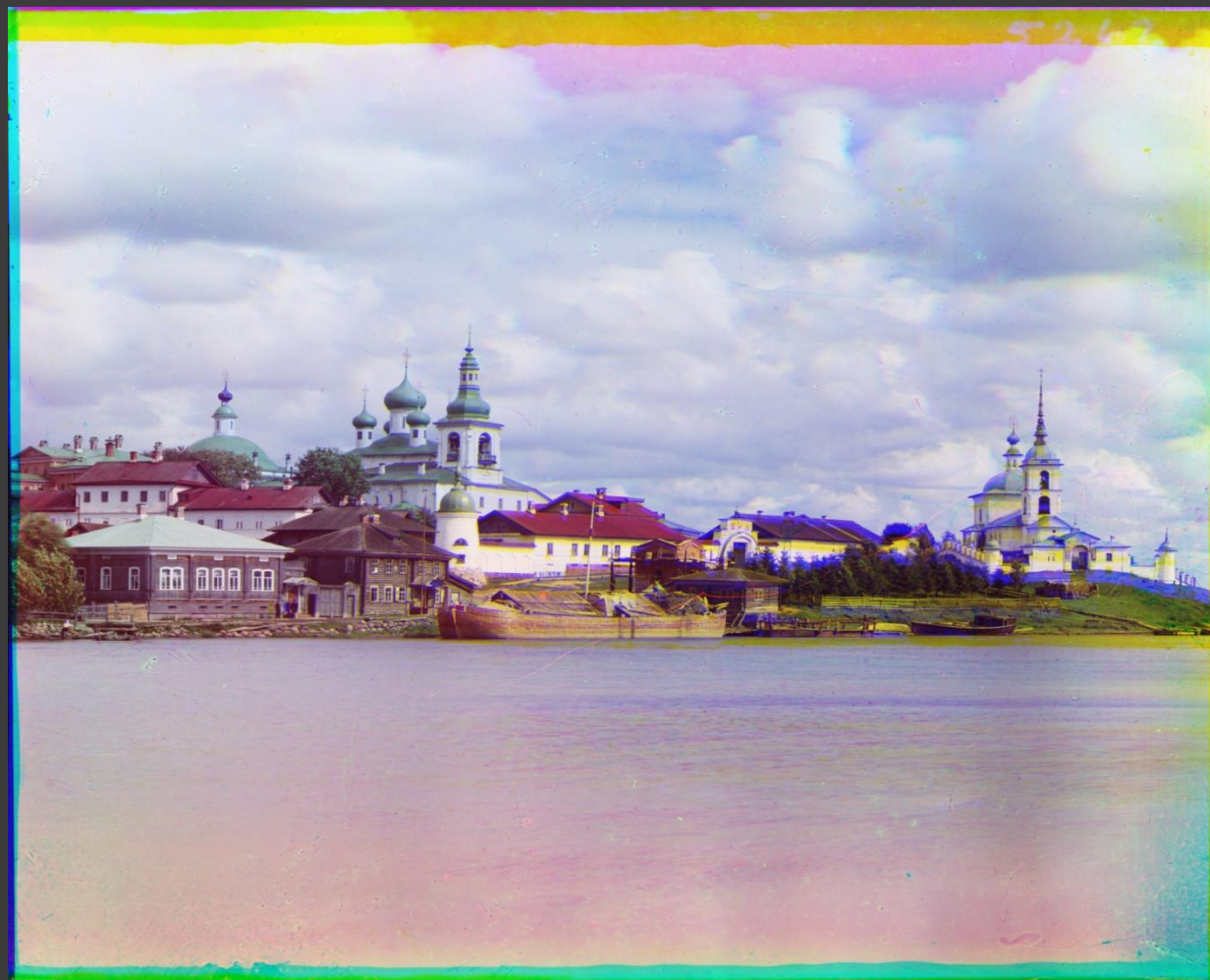
расцветенная фотография 1909 года