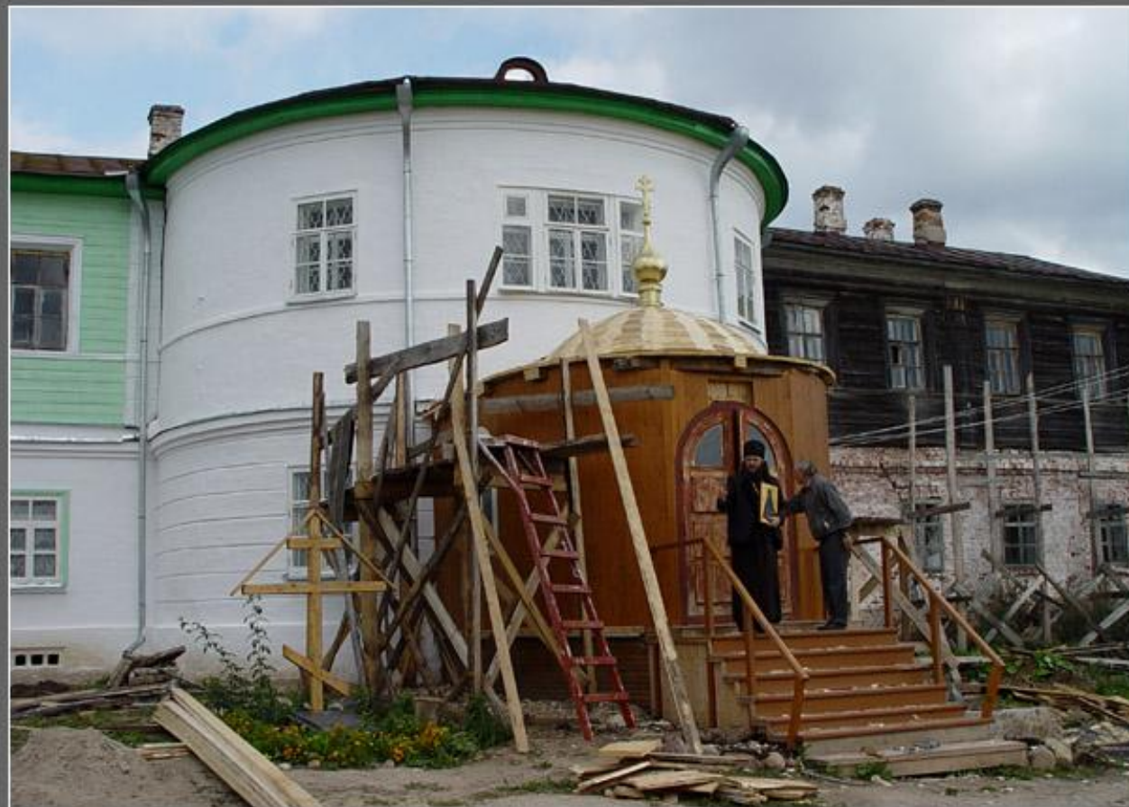
Горицкий монастырь. Домовая церковь.