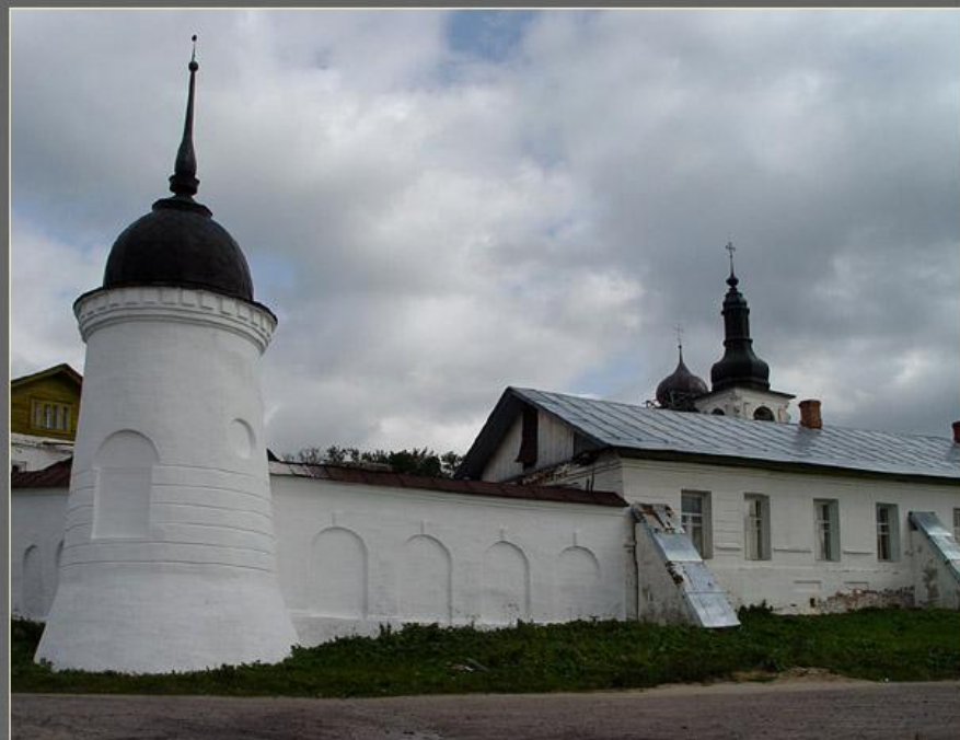
Горицкий монастырь. Угловая башенка на набережной Шексны.