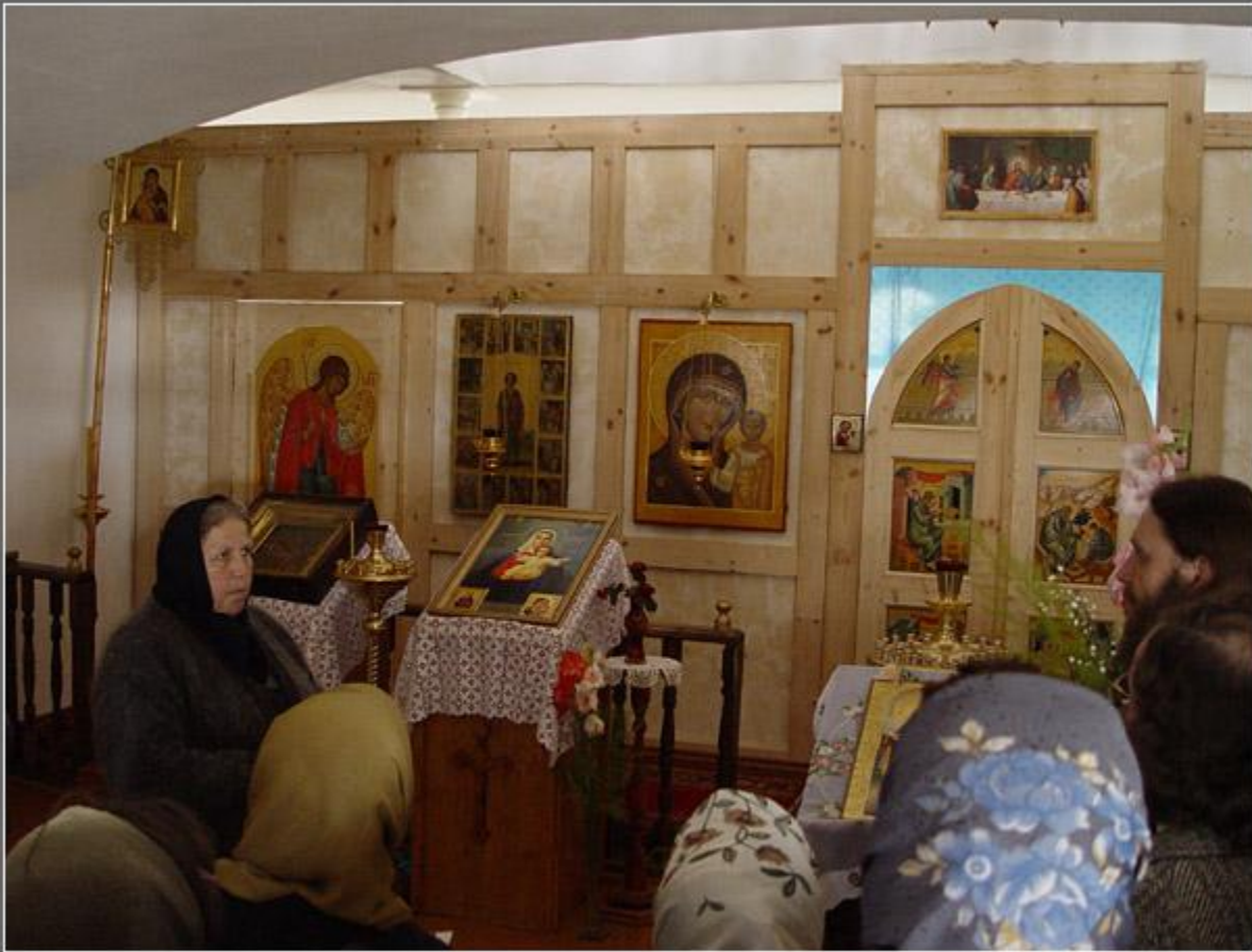
Горицкий монастырь. В домово́й церкви обители.