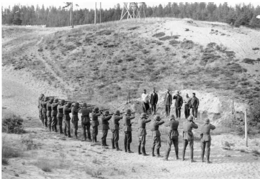
September 1941

Всего нацистами было уничтожено более 40 тысяч человек, 53 тысячи ростовчан было угнано в Германию на принудительные работы.