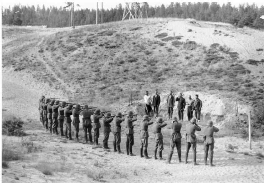
September 1941

Всего нацистами было уничтожено более 40 тысяч человек, 53 тысячи ростовчан было угнано в Германию на принудительные работы.