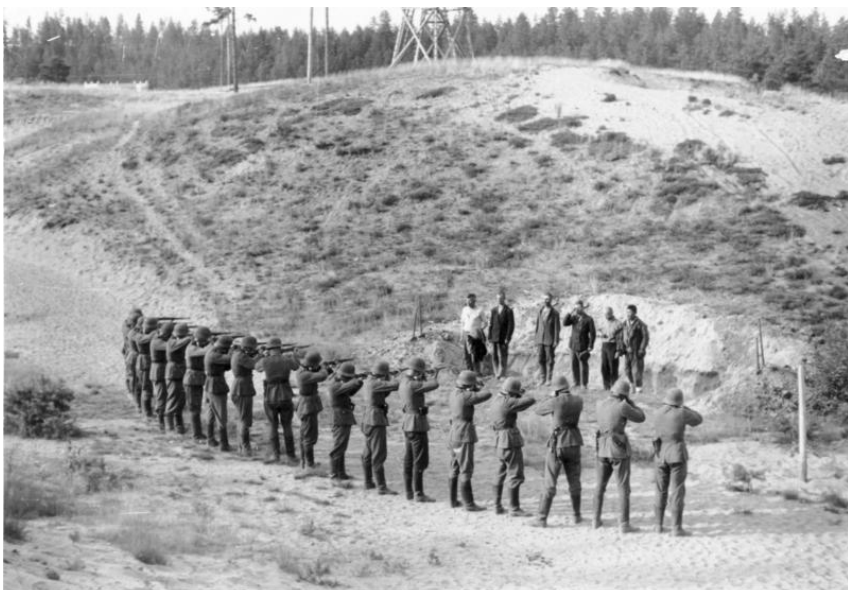
September 1941

Всего нацистами было уничтожено более 40 тысяч человек, 53 тысячи ростовчан было угнано в Германию на принудительные работы.