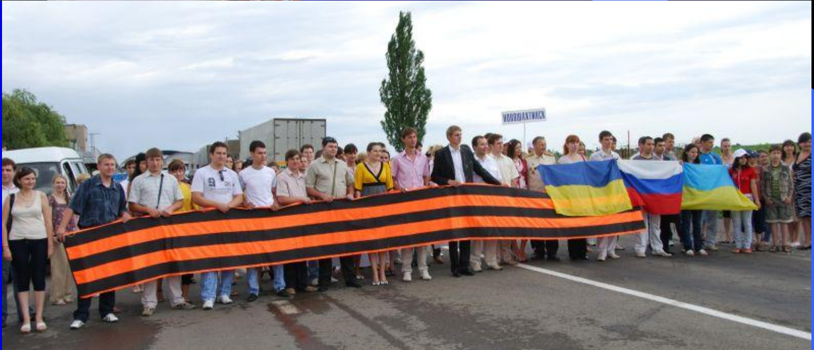
Международная акция «Улица Дружбы»