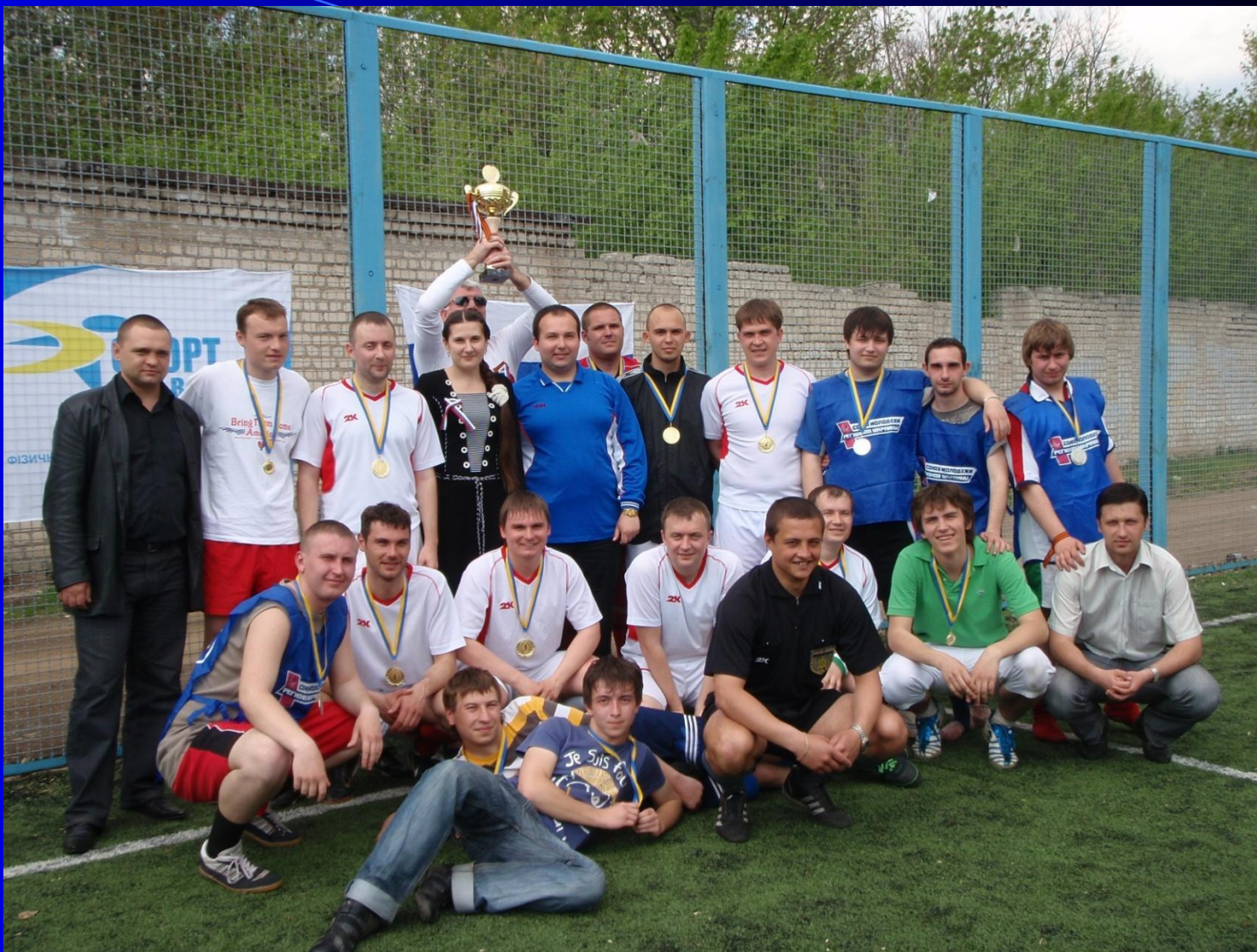
Международные ежегодные соревнования по минифутболу «Кубок Победы»