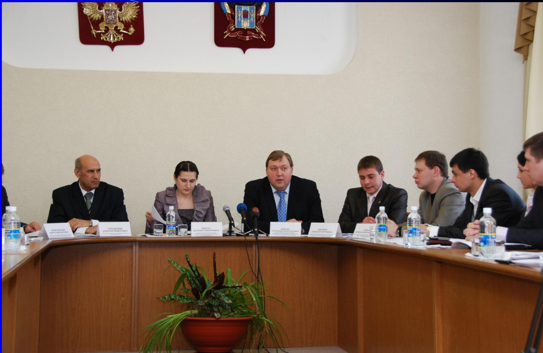
Заседание комиссии по законодательству, градостроительству и местному самоуправлению