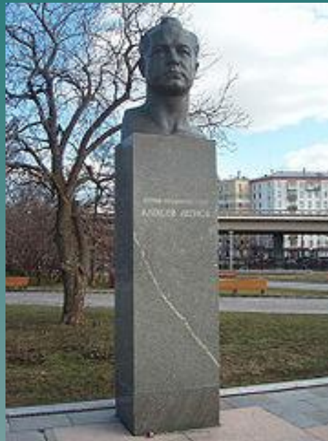
Памятник Леонову в Москве