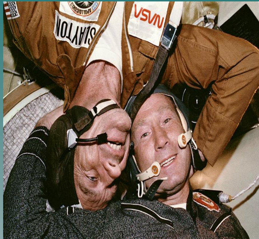
Дональд Слайтон и Алексей Леонов