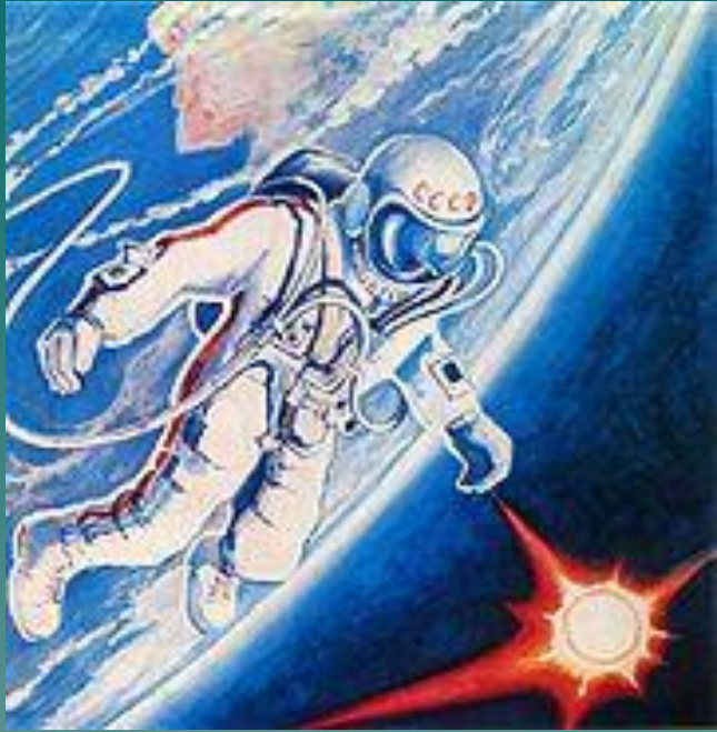
А. Леонов Выход в открытый космос