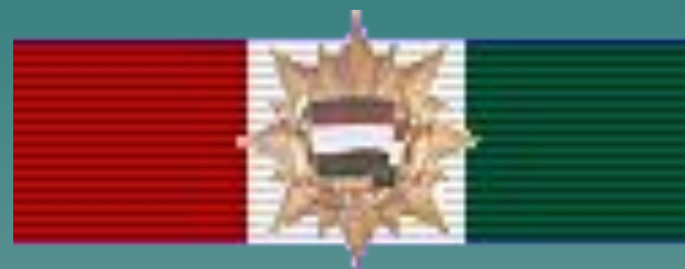
Орден Знамени (ВНР)Hu3ofl0