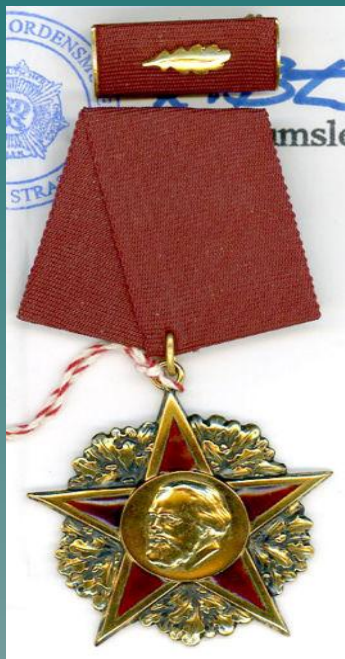
Орден Карла Маркса

Орден Государственного знамени ВНР ( ВНР , 1965)