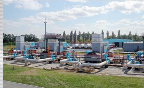
Трассами магистрального газопровода