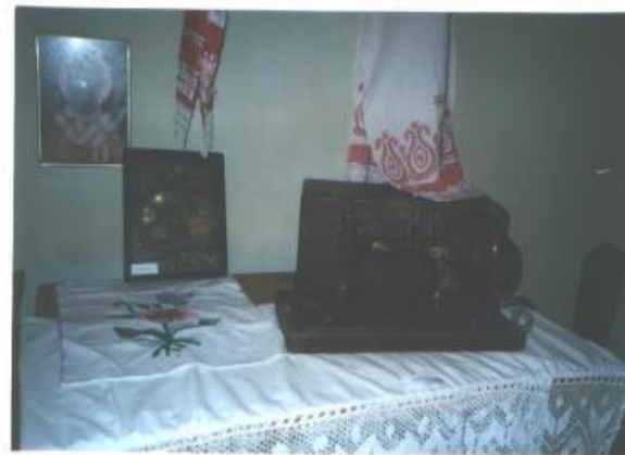
ГОРДОСТЬ МУЗЕЯ ИМ ЗИНГЕР"