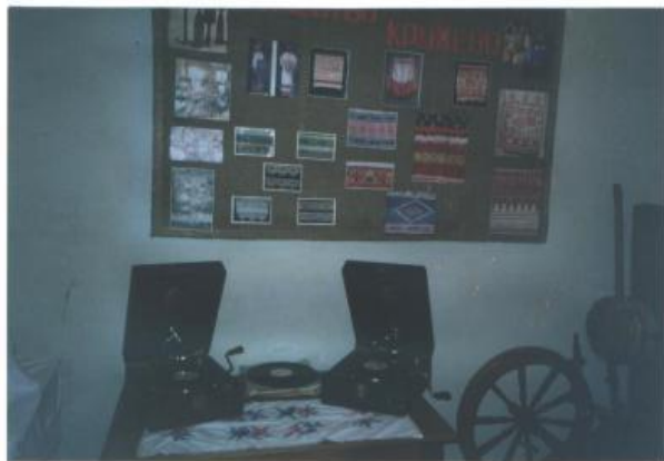
ПАТЭ ФОННЫ 40* ГОЛОВ