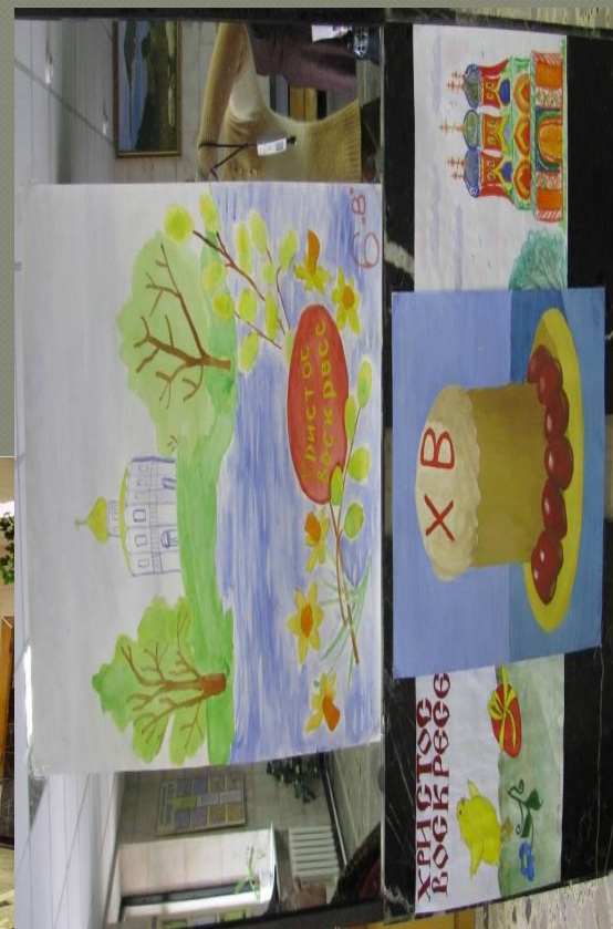
Традиционные Пасхальные и Рождественские праздничные выставки детского творчества в сельском Доме Культуры