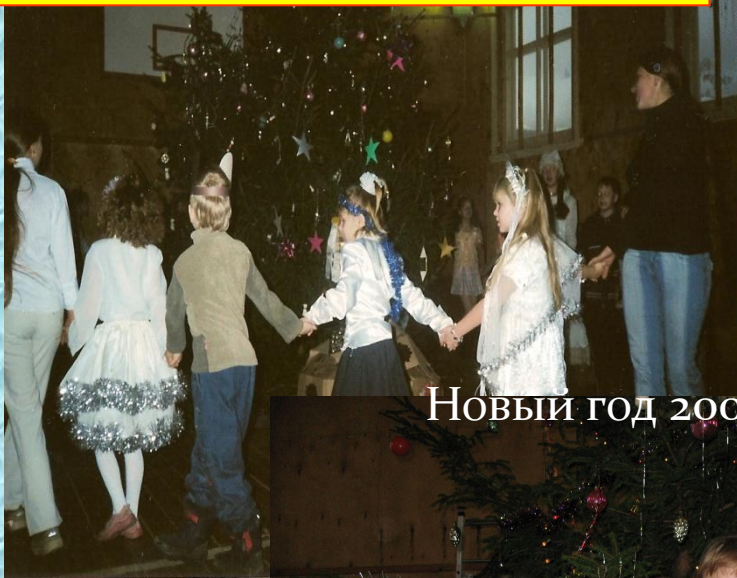
Новый год 2009 год