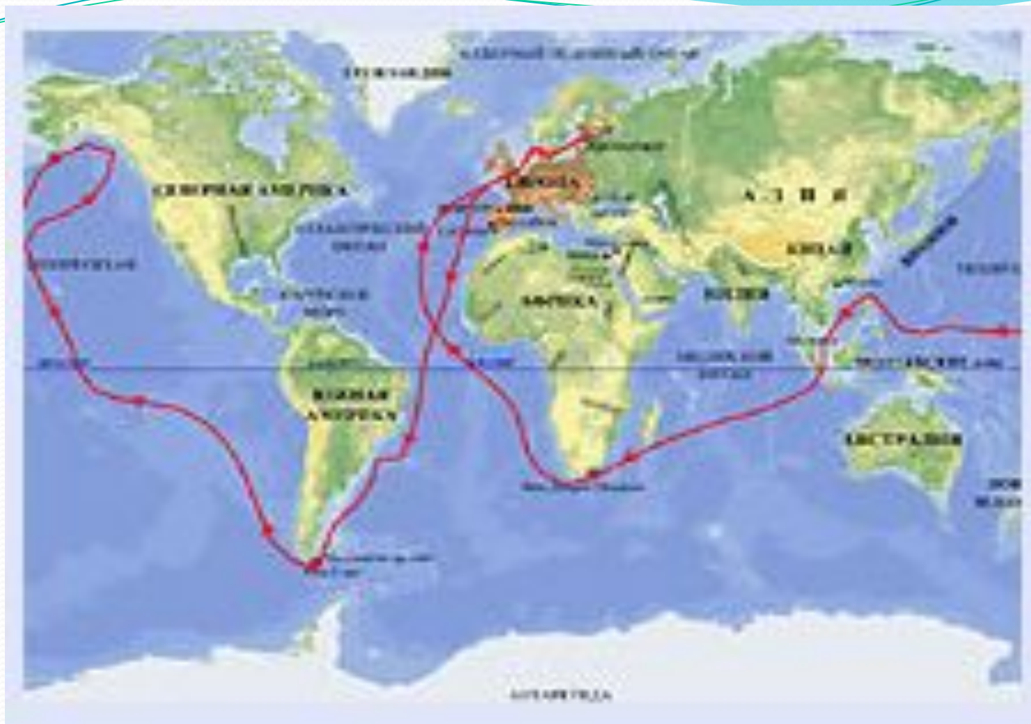
Карта кругосветного путешествия И.Ф. Крузенштерна и Ю.Ф. Лисянского