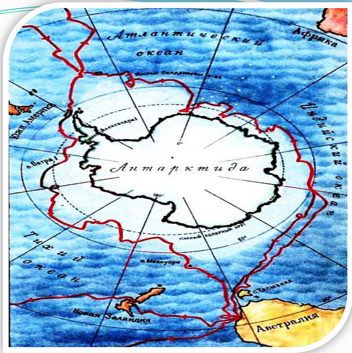
Карта кругосветного путешествия Ф.Ф Беллинсгаузена и М. П. Лазарева