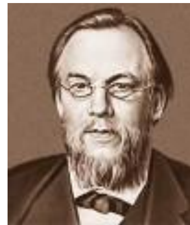
С. П. Боткин