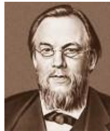
С. П. Боткин