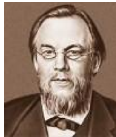
С. П. Боткин