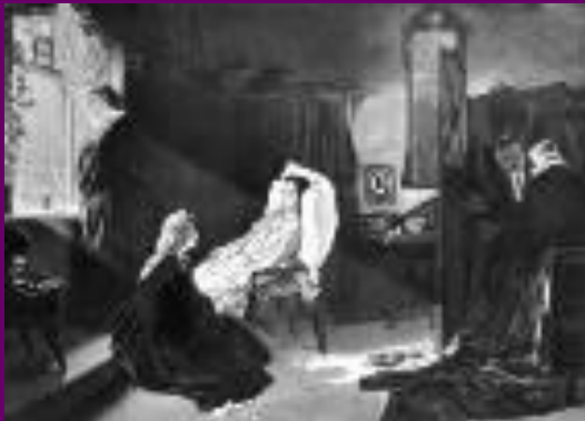
Бедная Лиза Орест Кипренский