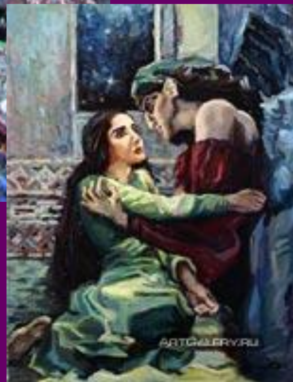
«Тамара и демон»