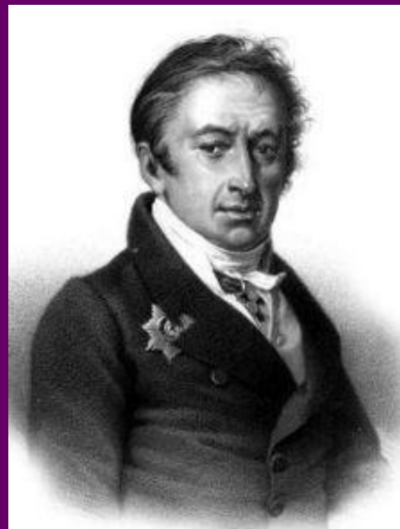
Портрет Карамзина. Худ. Тропинин.