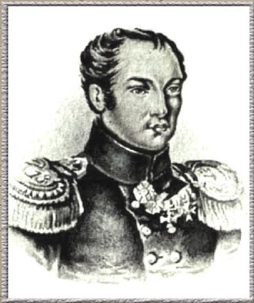
Павел Иванович Пестель.