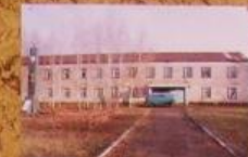
Административное здание совхоза в 80-ые гг.

Административное здание совхоза было построено в 1980-е годы. Это было современное здание, которое служило центром совхоза. Здесь работали все сотрудники совхоза.