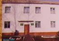
Детский сад «Колосок».

Вот так выглядела наша школа в 1941-1945 гг. Это было время, когда наши земляки сражались за нашу Родину. Школа была местом, где дети готовились к жизни в трудные времена.