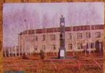
Облава участников Великой Отечественной войны 1941-1945 гг.

Вот так выглядела наша школа в 1941-1945 гг. Это было время, когда наши земляки сражались за нашу Родину. Школа была местом, где дети готовились к жизни в трудные времена.