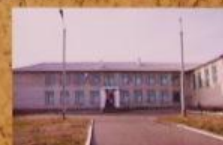
В 1999 г. была построена новая средняя школа в нашем селе.

Школа в нашем селе была построена в 1950-е годы. Это было первое здание школы после войны. Школа стала местом, где дети получили хорошее образование и подготовку к жизни.