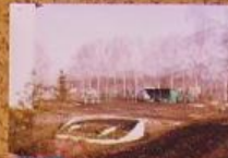
Игровая площадка в детском саду.