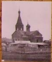
Так выглядела церковь в 50-ые гг.

Церковь в нашем селе была построена в 1950-е годы. Это было первое здание церкви после войны. Церковь стала местом, где люди находили утешение и поддержку.