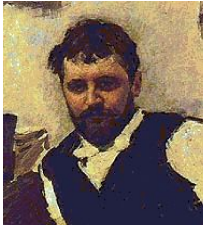
В.Серов. Портрет К.Коровина