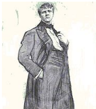
В.Серов. Портрет Ф. Шаяпина