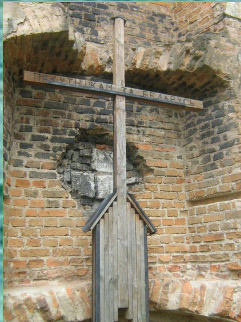
Руины каплицы – памятника архитектуры XVIII века