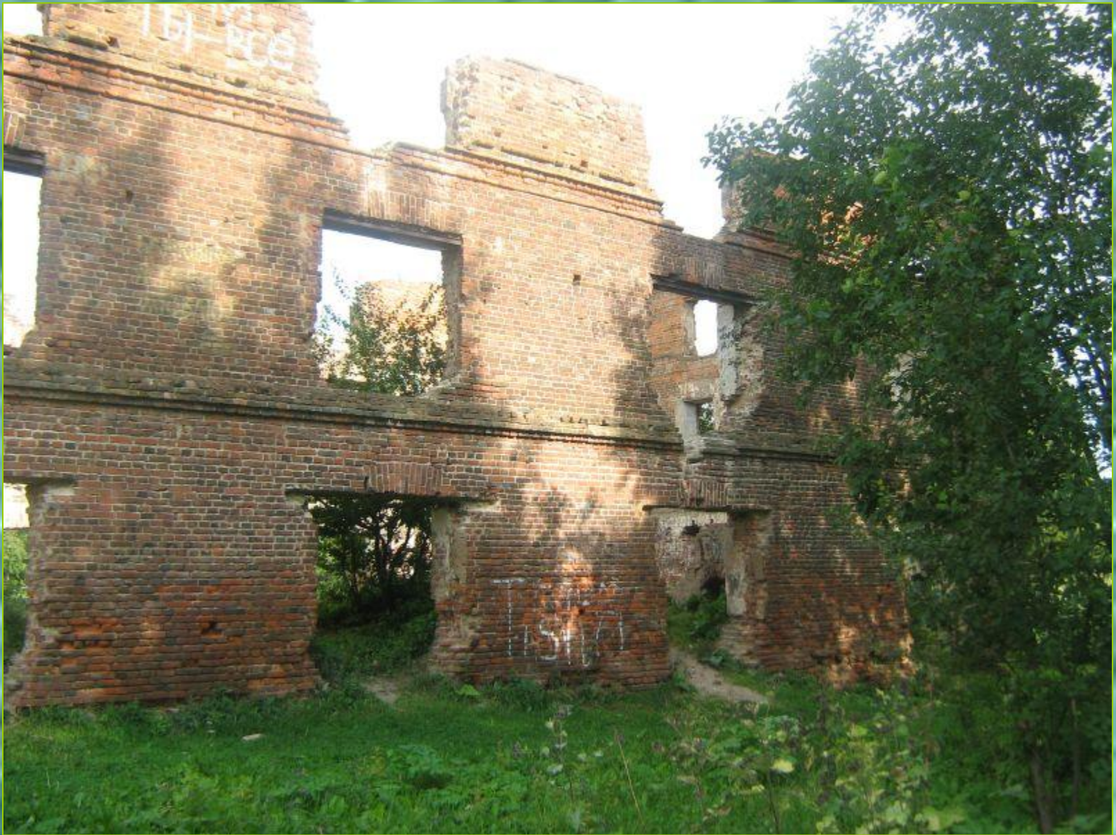
Руины красной водяной мельницы