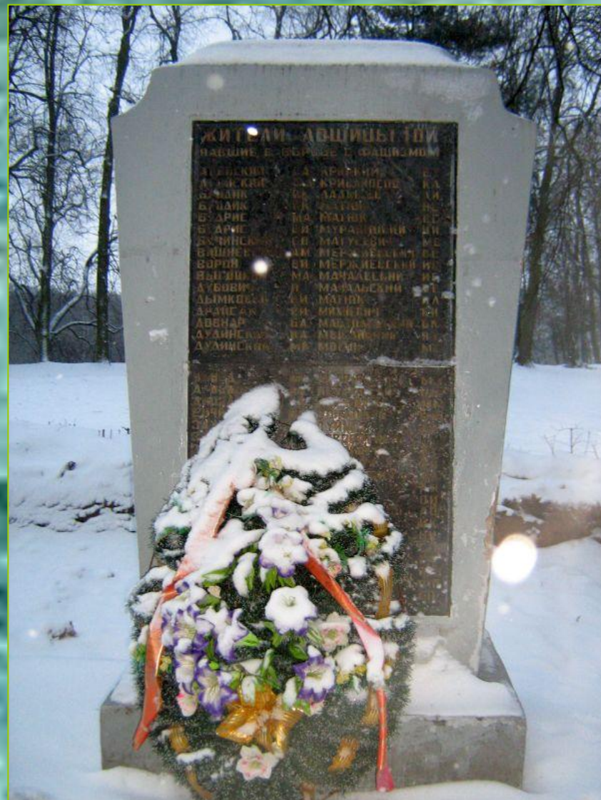
Братские могилы воинов, погибших при освобождении Минска в июле 1944 года