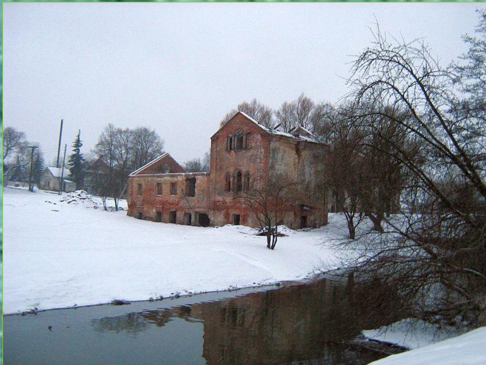
Строения белой водяной мельницы