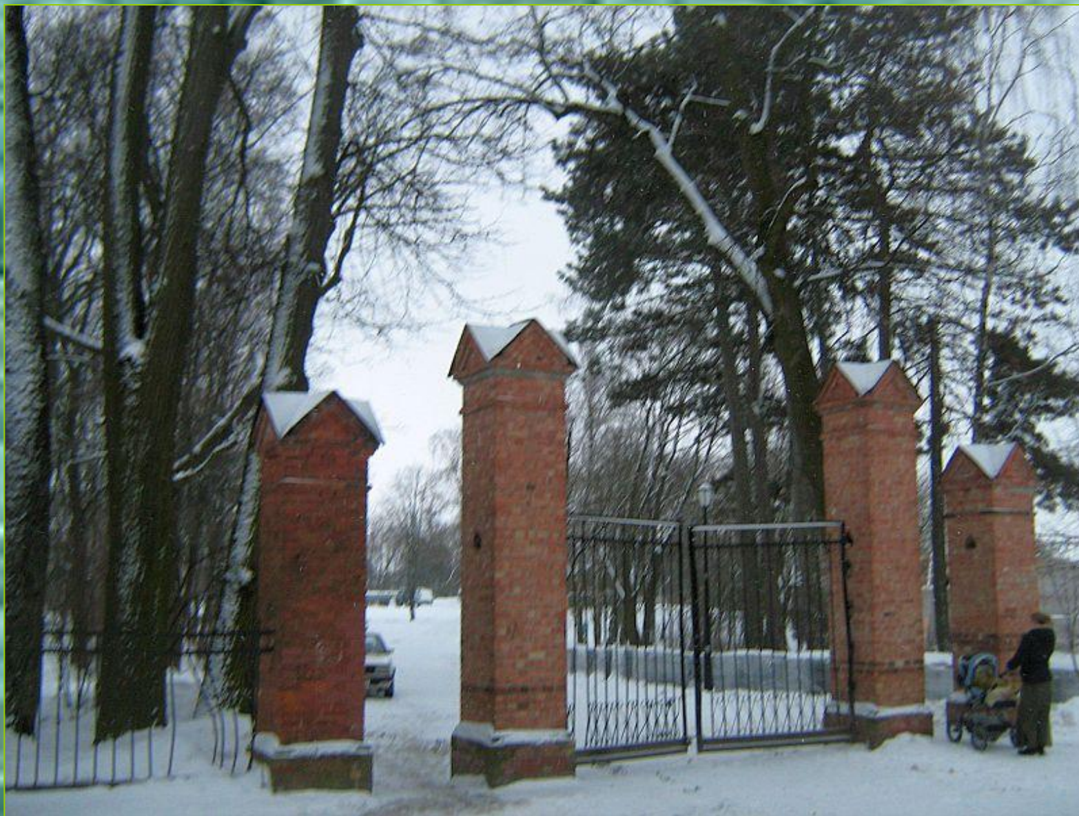
Парадный въезд в усадьбу