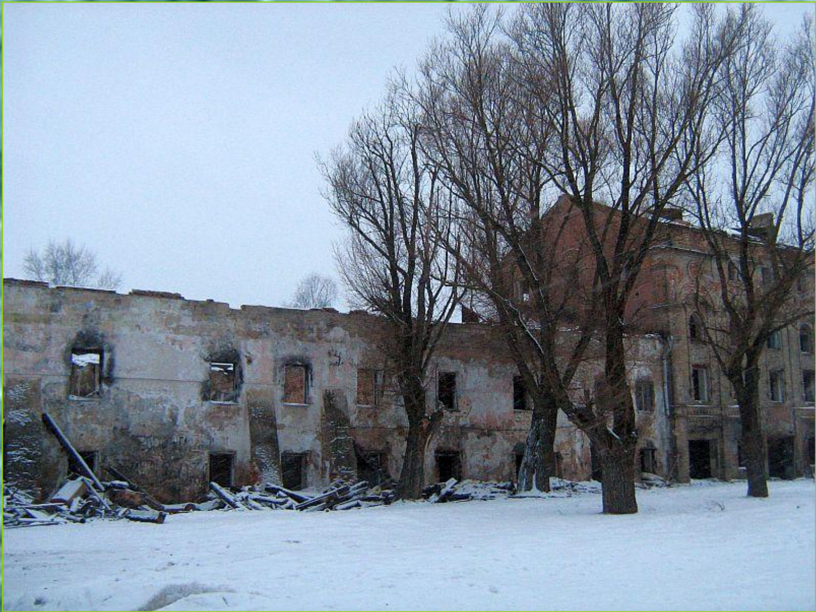
Здания бывшего винокуренного завода