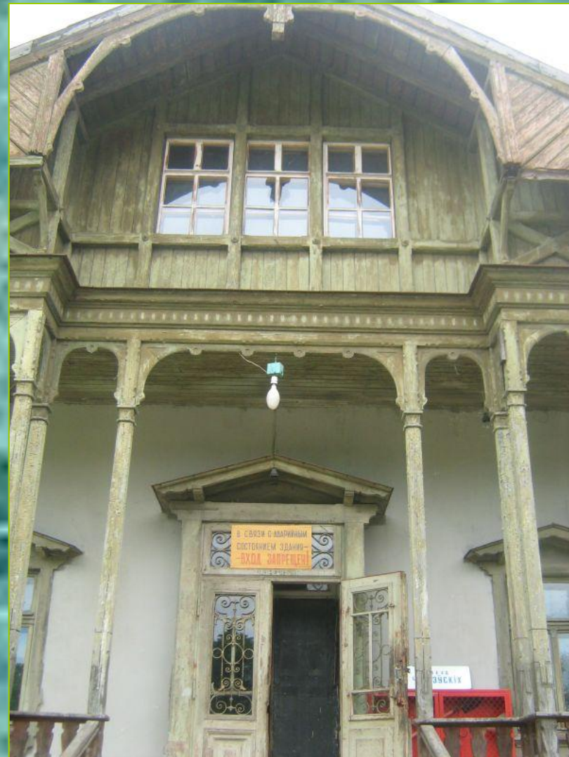
Усадебный дом. Своеобразная архитектурная энциклопедия XIX века.