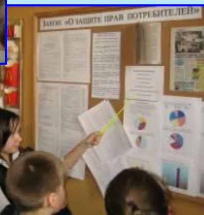
Защита прав потребителя