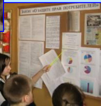
Защита прав потребителя