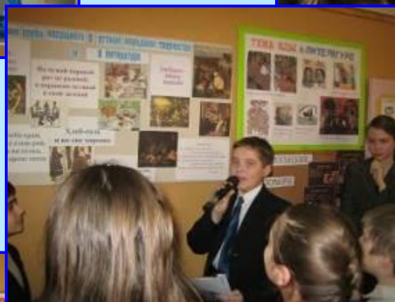
Тема еды в искусстве