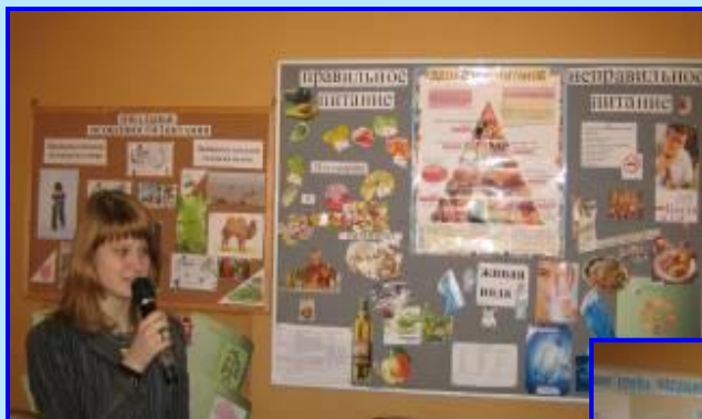
Особенности зонального питания