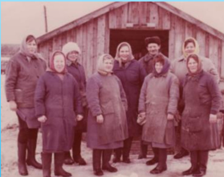
2 песцовая бригада