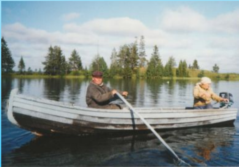
Любимое увлечение Григорьевых - рыбалка