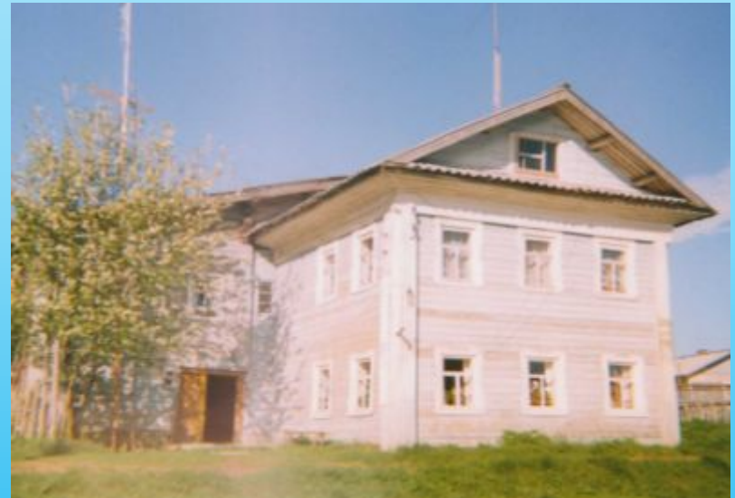
Дом Григорьевых в Шуезере 1917г. постройки