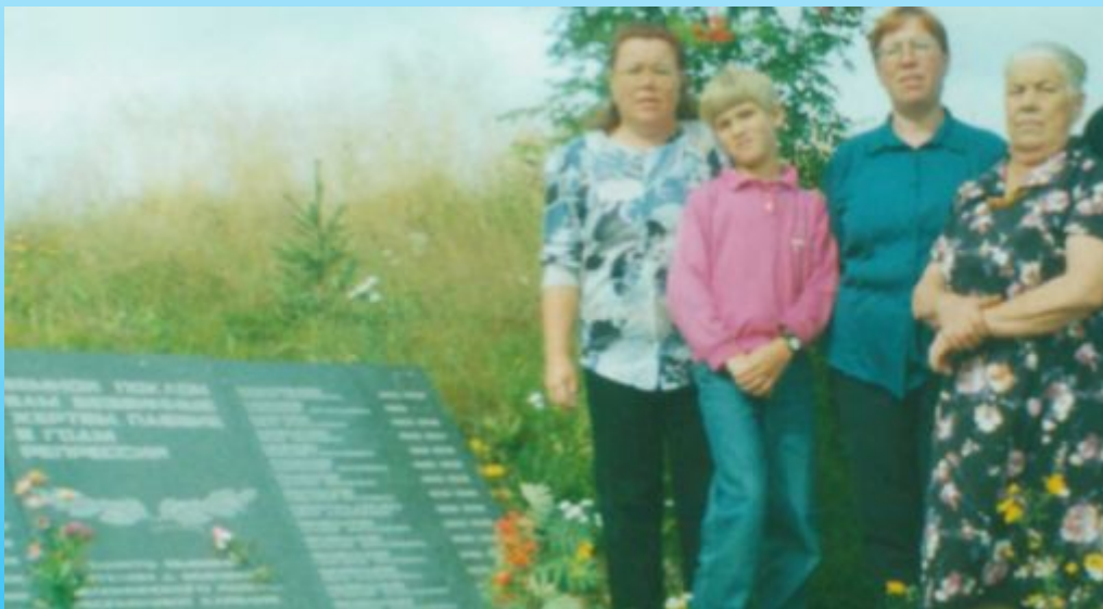
С семьей у памятника жертвам политических репрессий в Шуезере