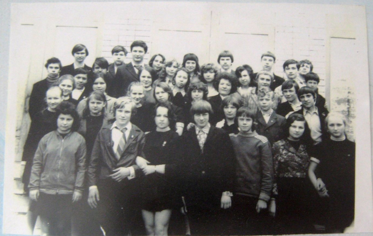
8"а" класс выпуск 1976 года.