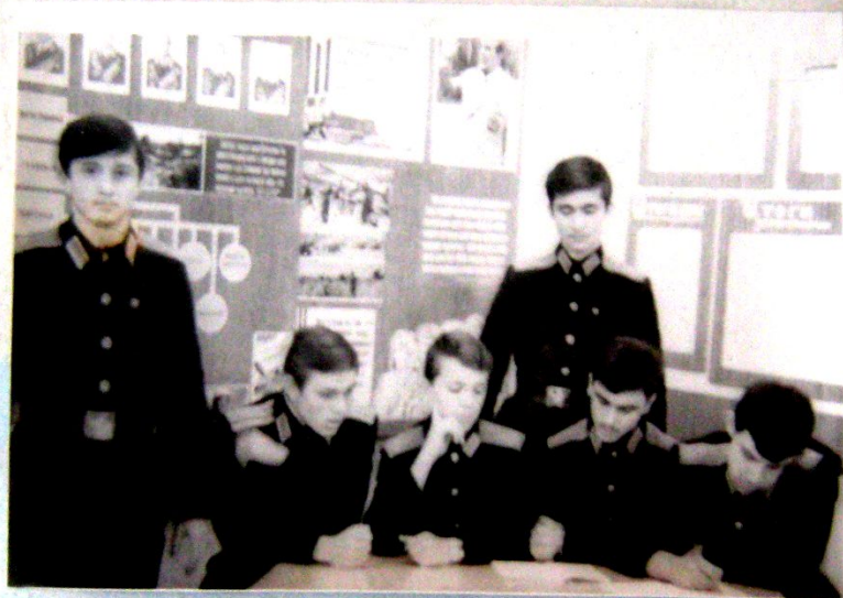
Минское суворовское училище 1978 г.