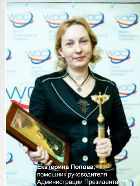
Екатерина Попова, помощник руководителя Администрации Президента РФ