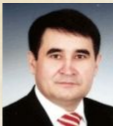
Камалов Хамит Искарлович

Степень MBA в бизнес-школе Чикагского университета Член Совета Федерации ФС РФ Председатель Комитета по финансовым рынкам и денежному обращению