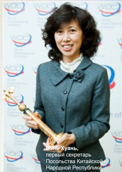
Вэнь Хуань, первый секретарь Посольства Китайской Народной Республики