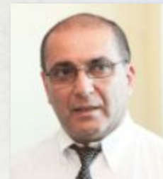
Тосунян Гарегин Ашотович

Сопредседатель Экспертного совета Кандидат экономических наук Депутат Государственной Думы ФС РФ Председатель комитета по экономической политике и предпринимательству Государственной Думы ФС РФ