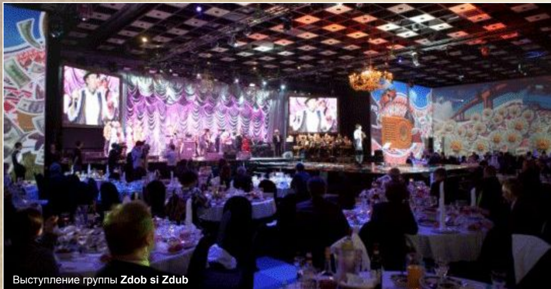
Выступление группы Zdob si Zdub