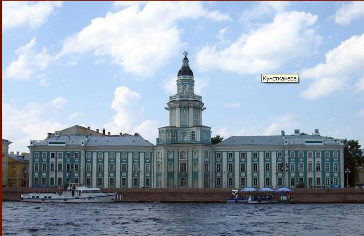
Кунсткамера в Петербурге