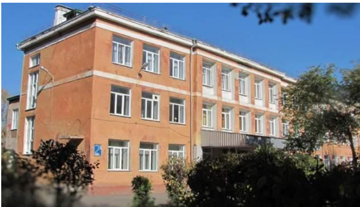
МБОУ СОШ №50 в новой обложке