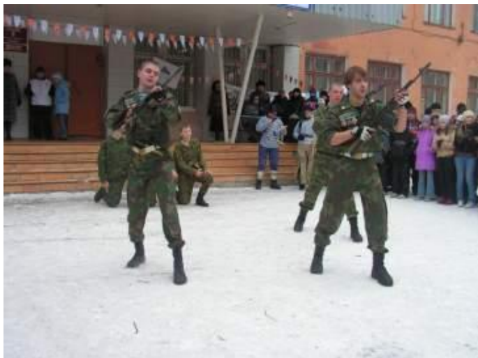
«Патриот идет вперед!»

Велика наша школьная рать, Педагогов закалка крепка, Если будешь ты, школа, стоять, Не иссякнет России река!