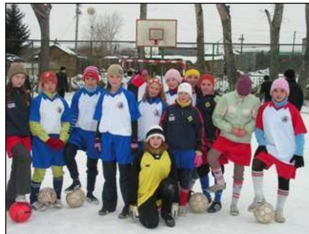
«Школа – территория здоровья»

ПОБЕДИТЕЛЬ «100 спортивных проектов» социальный проект компании РУСАЛ.