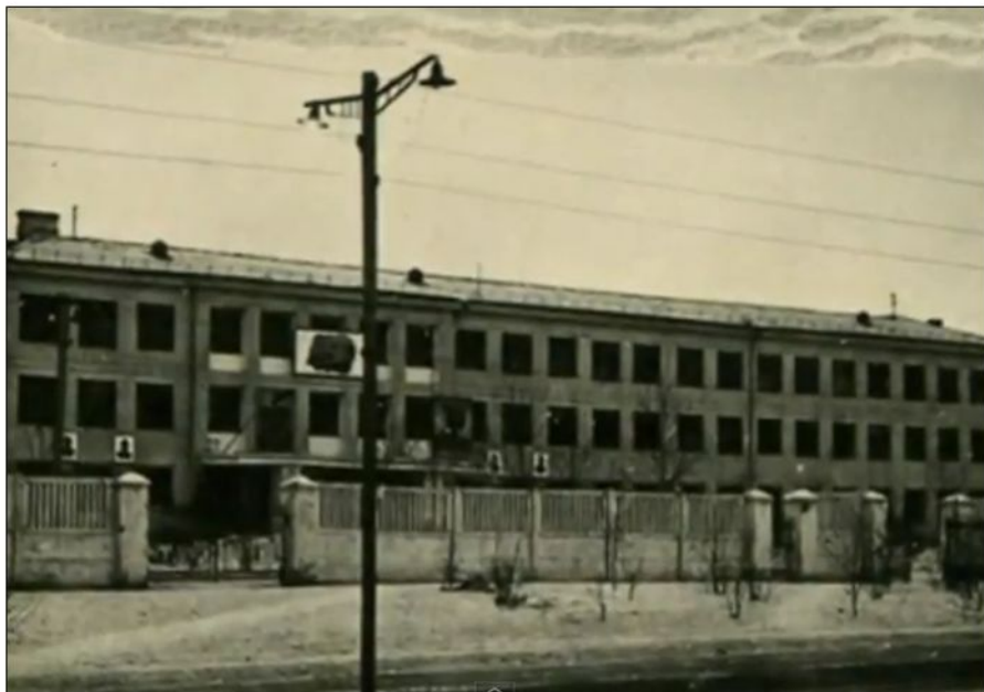
Новое здание школы №50 открытие 9 февраля 1955 г.

В октябре 1955г. по решению Ленинского райисполкома один из жилых домов был переоборудован под школу. В конце октября 1955г. все дети поселка Базаиха сели за парты. До открытия школы дети учились в школах № 16, 13, 47. Это было очень неудобно и родители обратились с просьбой в Ленинский райисполком с просьбой о создании школы. Решение было принято, деньги были отпущены, и строительный трест №47 выполнил порученное ему задание по открытию школы. В школе не было кабинетов и лабораторий, не было спортзала, но это никого не смущало. Ребята с увлечением занимались физкультурой в коридоре.