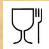
не токсичный материал