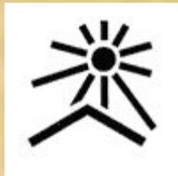
Беречь от нагрева