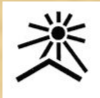
Беречь от нагрева