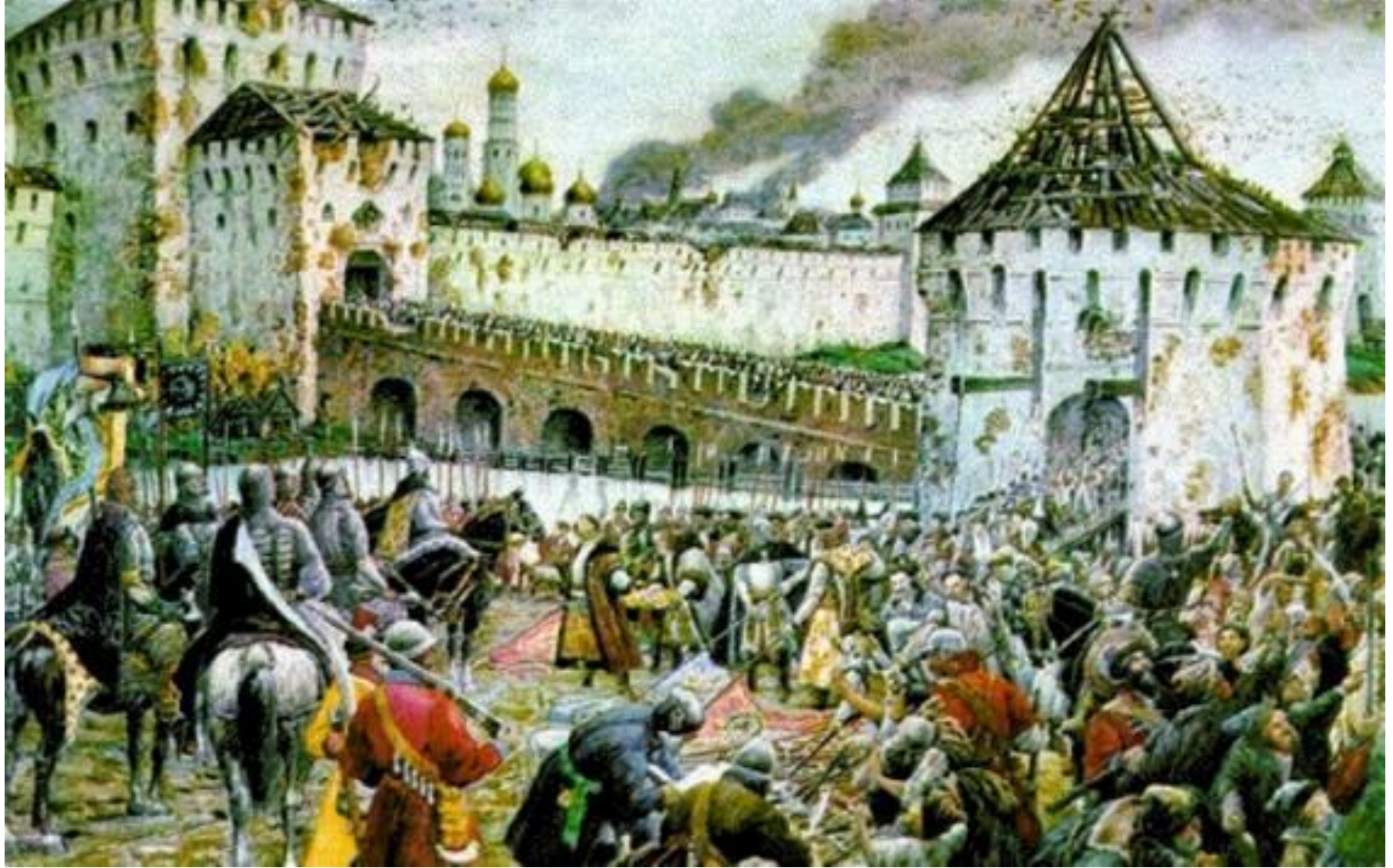
Изгнание польских интервентов из московского Кремля в 1612 году