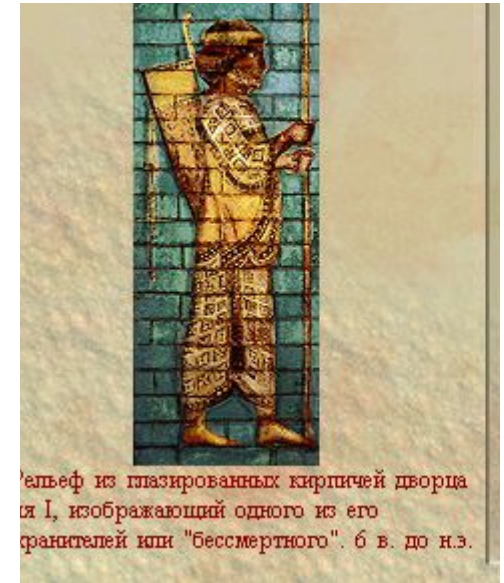
Рельеф из глазированных кирпичей дворца I, изображающий одного из его охранителей или "бессмертного". 6 в. до н.э.

Военное искусство Парфяне были очень воинственным народом, они славились своими наездниками и стрелками из лука. Римский писатель 2 в. н.э. Юстин сообщает: "Вся их жизнь проходила в седле: на войну и на пир, имея государственное или частное дело, они отправлялись на коне. Путешествуя, находясь на месте, по делу и без дела, - везде они находились в седле".