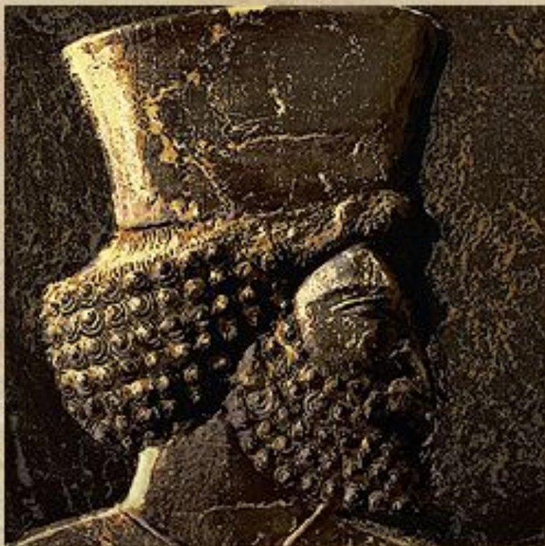
Правитель персидской державы в зале для аудиенций в Персидском дворце. 6 в. до н.э.