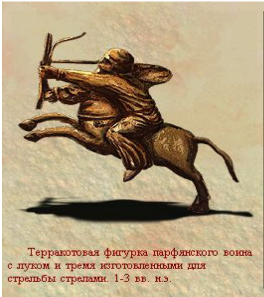
Терракотовая фигурка парфянского воина с луком и тремя изготовленными для стрельбы стрелами. 1-3 вв. н.э.