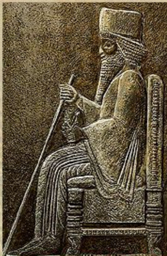
Изображение "Великого Царя, Царя Царей" из дворца в Персеполесе, управляющего своей обширной державой.