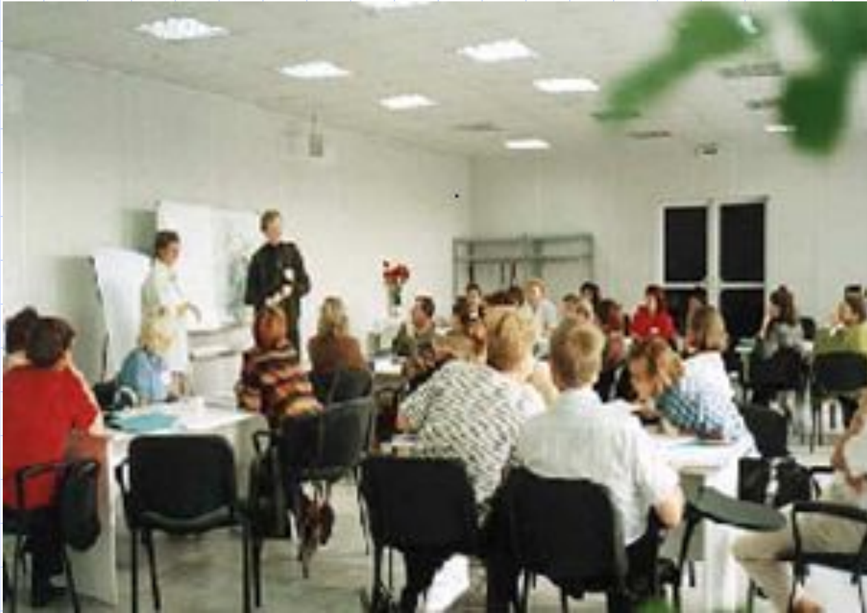
Семинар по курсу «Устойчивое развитие» г. Москва