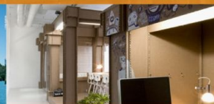
Офисы (например, рекламные агентства)