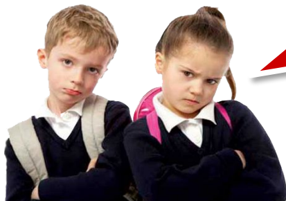
Дети в школах