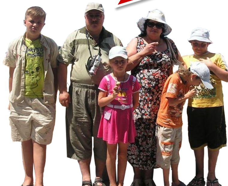
Отдыхающие в санаториях

Как можно выздороветь без нормального питания?