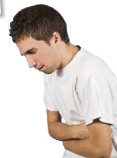
Больные в мед. учреждениях

Как можно выздороветь без нормального питания?