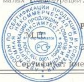
Схема сертификации № 3, Линия выполнена на основе трубопровода из полиэтилена. Пригодна для транспортировки молока, допустимо и возможна промывка кислотой и щелочью малых концентраций. Имеет белую индикаторную полосу.