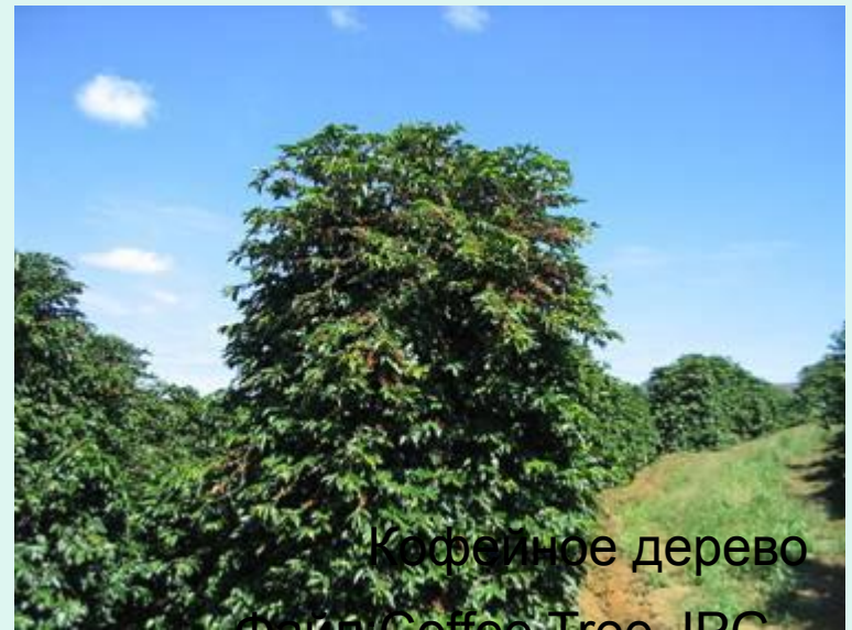
Кофейное дерево Файл: Coffee Tree.JPG