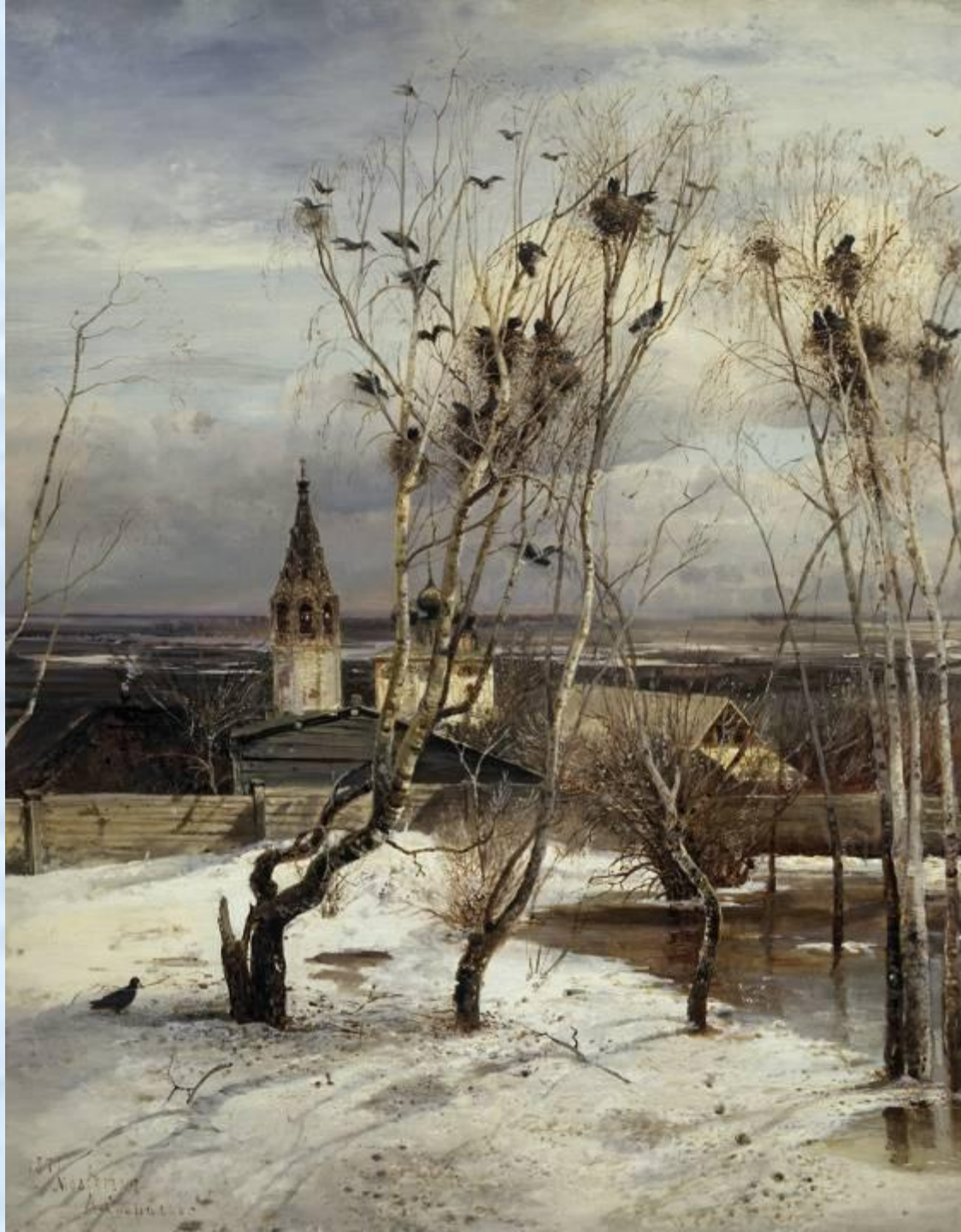
А.К. Саврасов «Грачи прилетели»