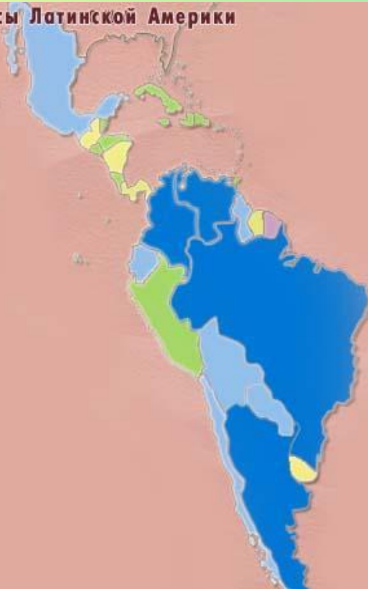
Водные ресурсы Латинской Америки