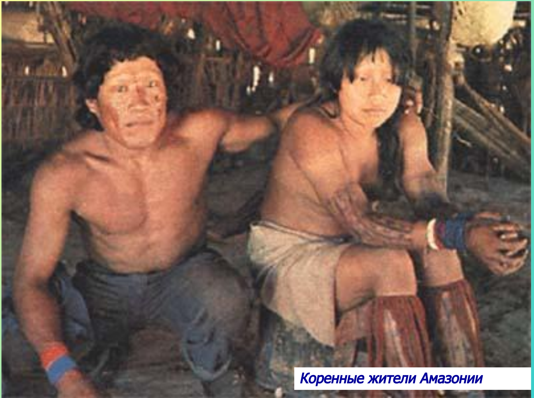
Коренные жители Амазонии