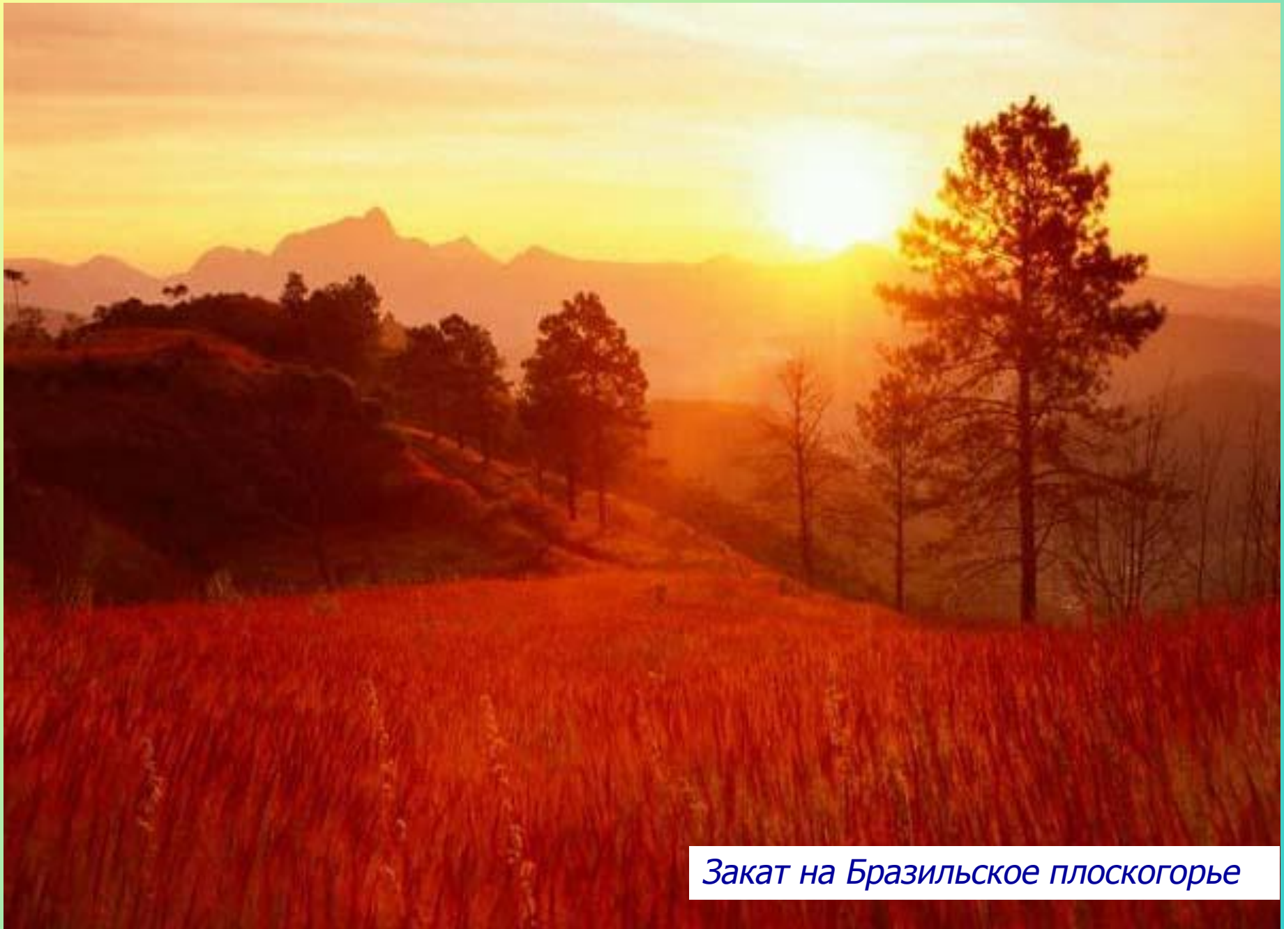
Закат на Бразильское плоскогорье