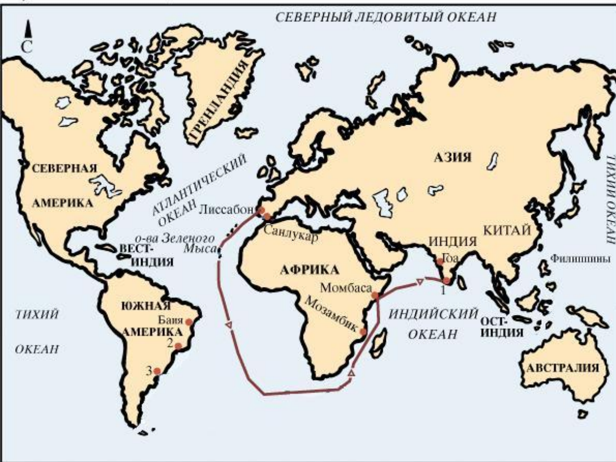
Путешествия Васко да Гама