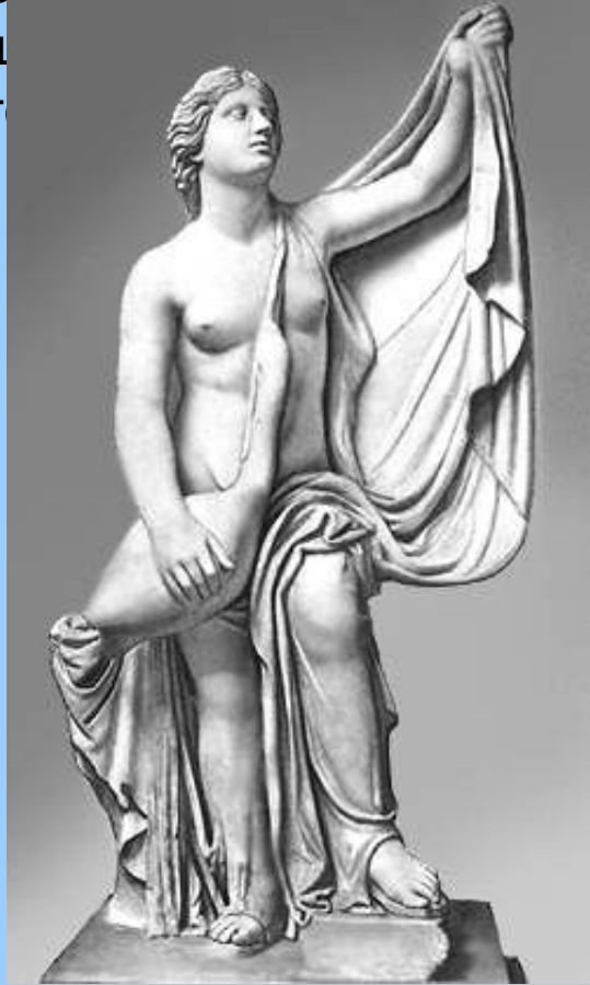
«Леда с лебедем». Римская мраморная копия с греческого оригинала скульптора Тимофея. 4 в. до н. э. Вилла Альбани. Рим.