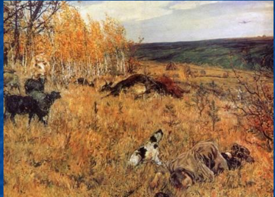
А. Пластов. Фашист пролетел. 1942

Быть может, самым страшным, что мог увидеть на войне взрослый человек: солдат, журналист, поэт — было то, что происходило с детьми. Дети не только становились сиротами. Они погибали, страдали в плену и оккупации, самоотверженно трудились в тылу, сражались с врагом в партизанских отрядах, были сыновьями и дочерьми полка в действующей армии. Часто дети становились героями произведений о войне.