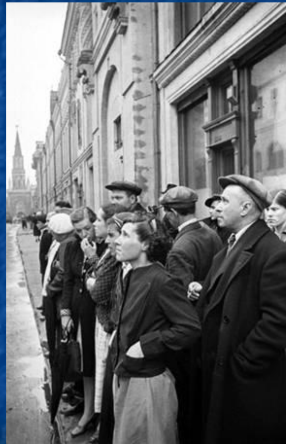
Москва. 22 июня 1941 г.