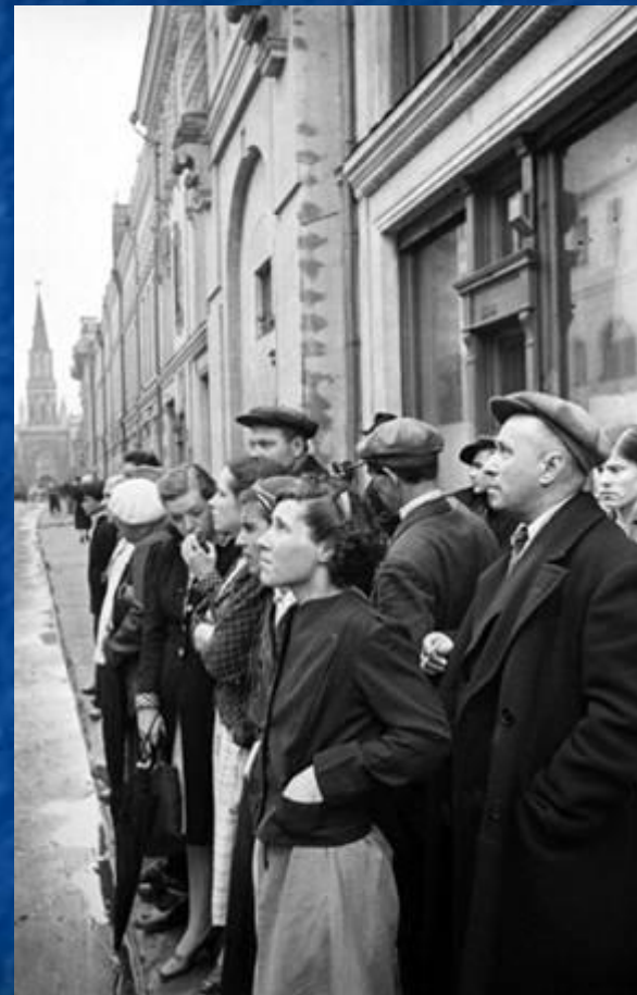
Москва. 22 июня 1941 г.