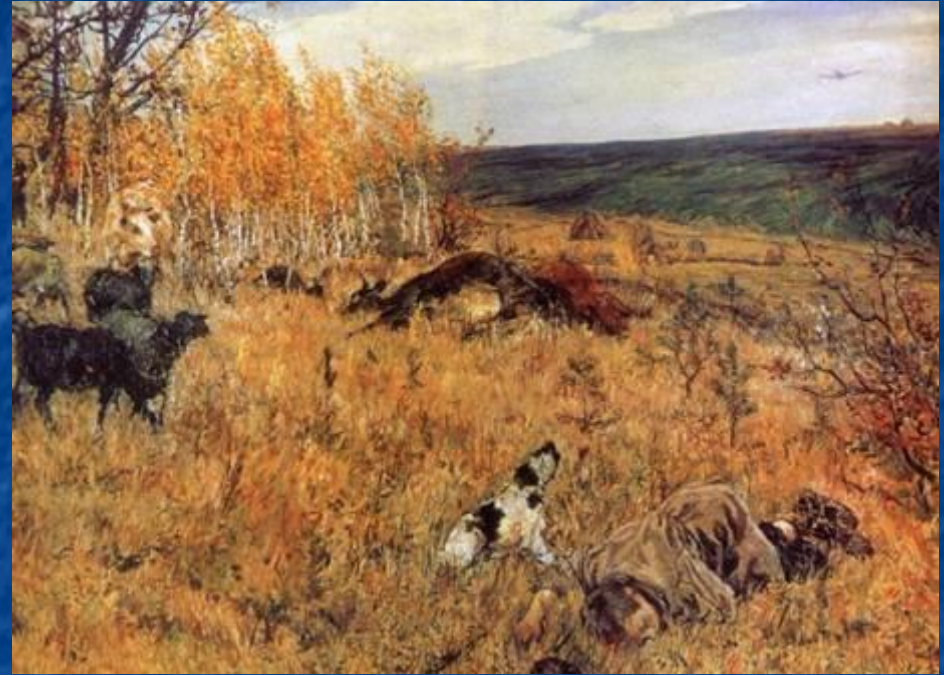
А. Пластов. Фашист пролетел. 1942

Быть может, самым страшным, что мог увидеть на войне взрослый человек: солдат, журналист, поэт — было то, что происходило с детьми. Дети не только становились сиротами. Они погибали, страдали в плену и оккупации, самоотверженно трудились в тылу, сражались с врагом в партизанских отрядах, были сыновьями и дочерьми полка в действующей армии. Часто дети становились героями произведений о войне.