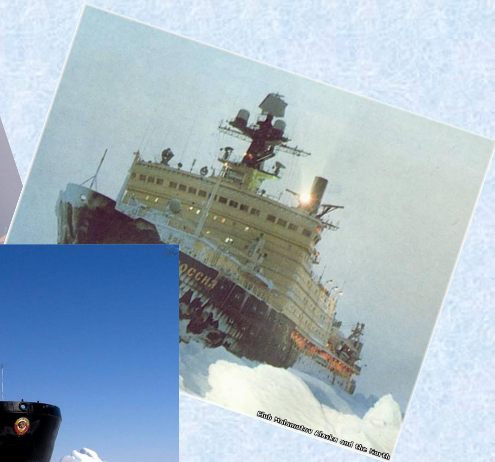
Club Malamutov Alaska and the North