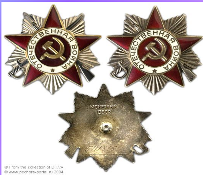
Орден Отечественной войны